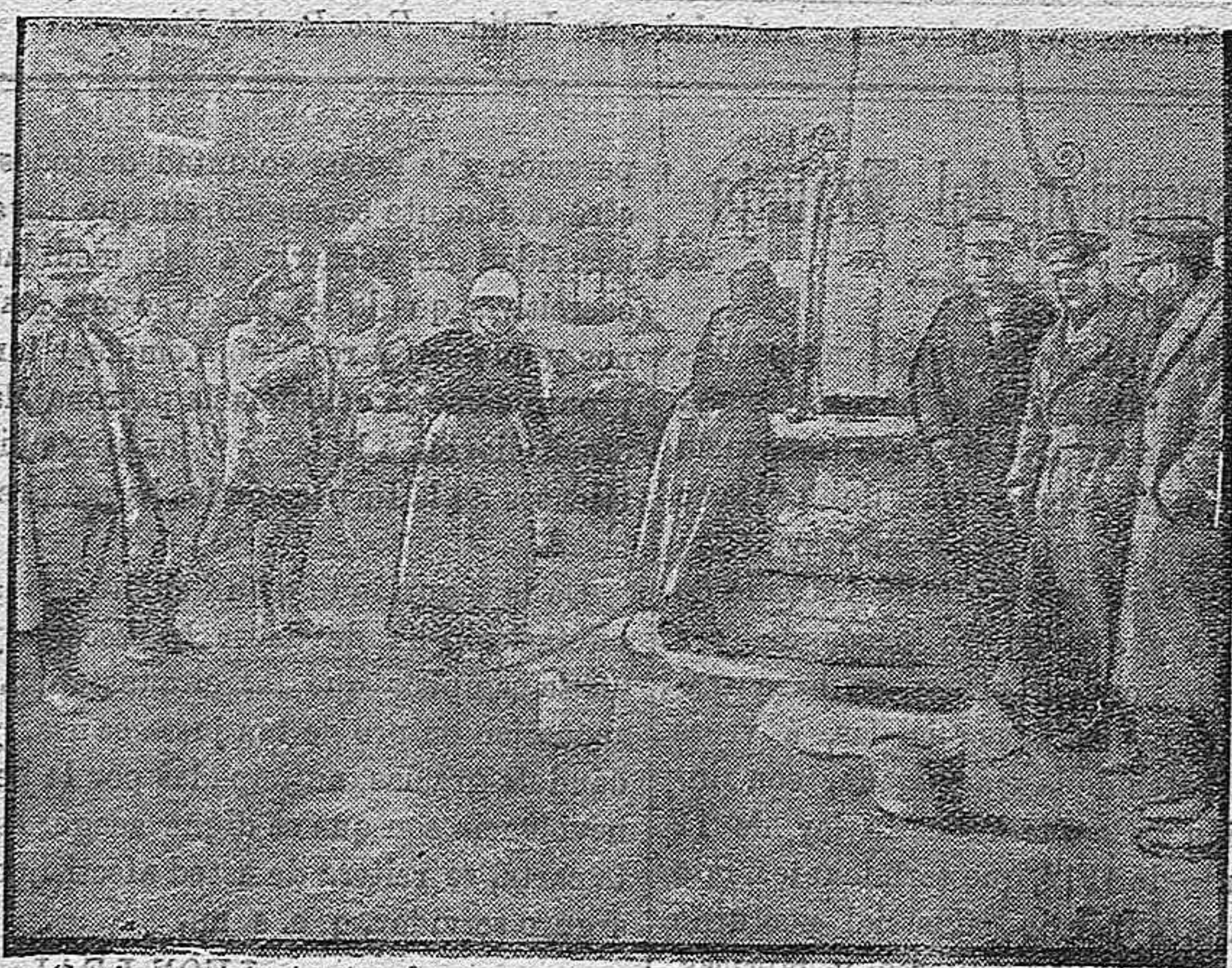
Cochinas ambulantes francesas en una granja.—Foto-R. del Rivero