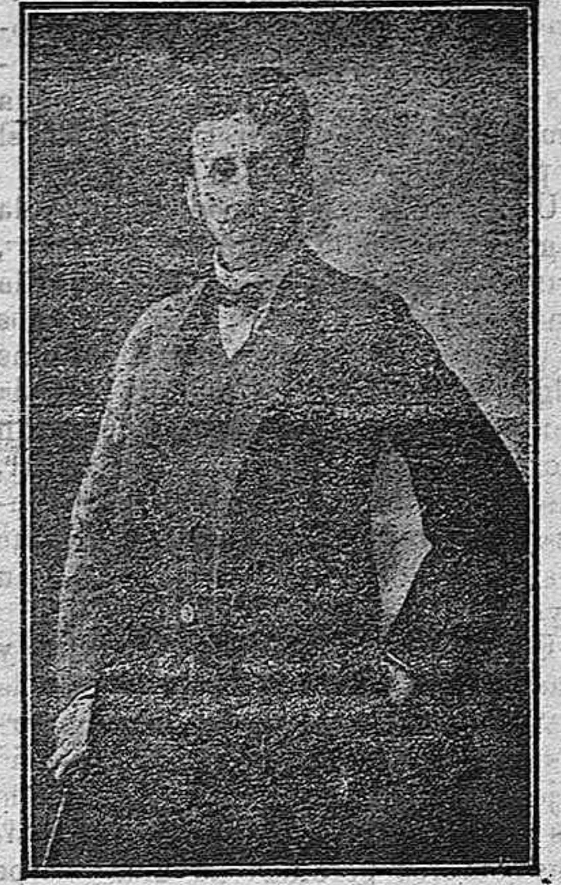
Excmo. Sr. Marqués del Vado del Maestro

El rubí, la esmeralda, el topacio, la turquesa y el diamante no han podido ocultar por más tiempo la humildad de su origen.