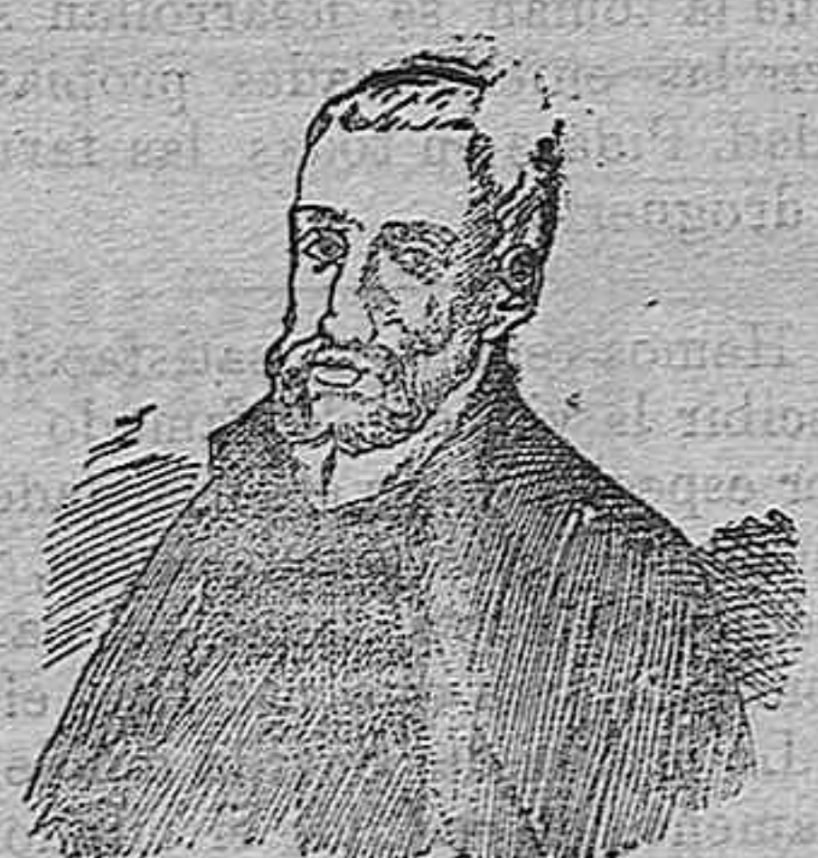
D. Juan Ginés Sepúlveda.

(Nació en Pozoblanco (Córdoba) en 1490—f. en Pozoblanco en 1573.