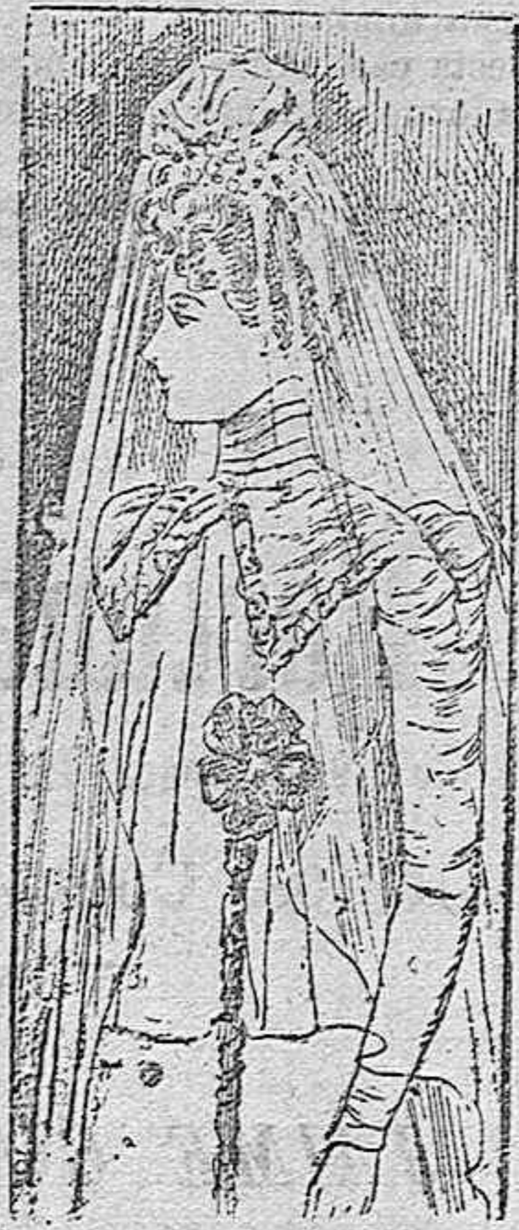
TRAJE PARA NOVIA

De lana. Cuerpo ajustado, con cuello y solapas de terciopelo. Va adornado con tres tirillas, también de terciopelo, una á lo largo de cada costado del cuerpo y otra en el centro del delantero. Pechera y cuello de gasé. Mangas estrechas; cinturón de seda y falda con dos tiras de terciopelo colocadas á continuación de las de los costados del cuerpo.