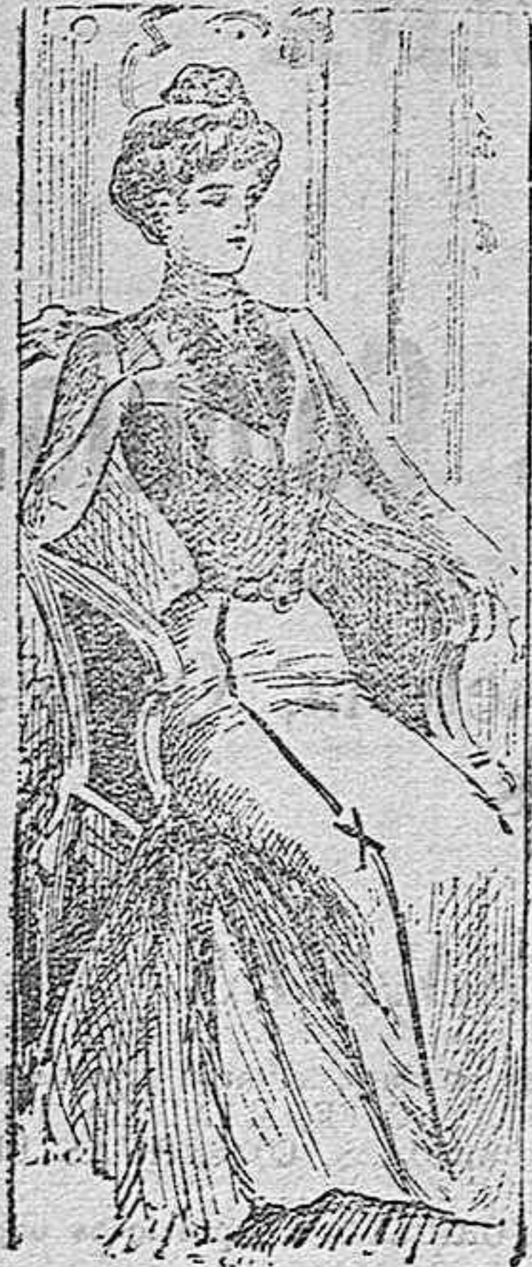
TRAJE PARA PRIMAVERA

Modelos exclusivos para nuestras lectoras de los Grandes almacenes de EL SIGLO, Barcelona