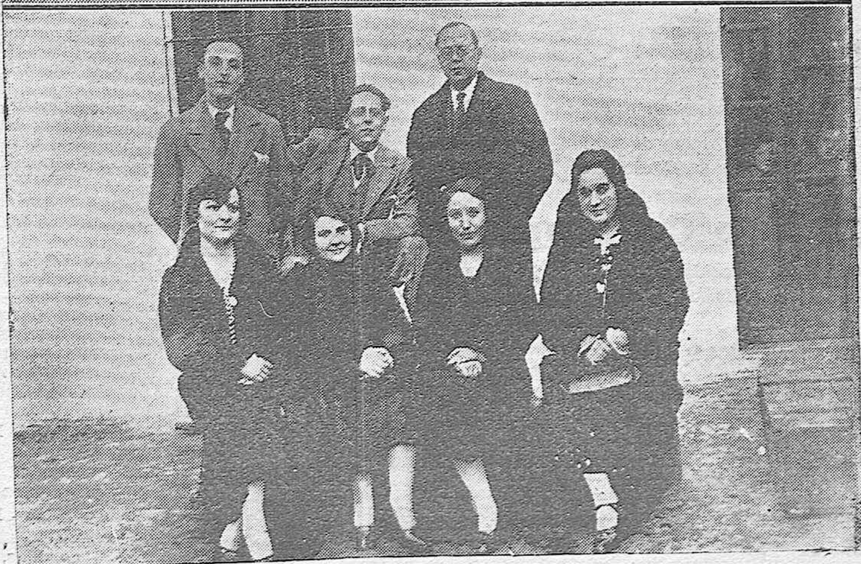
El gobernador civil señor Gardoqui en unión de otras personas viendo los terrenos donde se ha de levantar el nuevo Cuartel de la Guardia civil en Villaviciosa de Córdoba.—Los maestros nacionales del mencionado pueblo que se encontraban allí durante los sucesos revolucionarios.