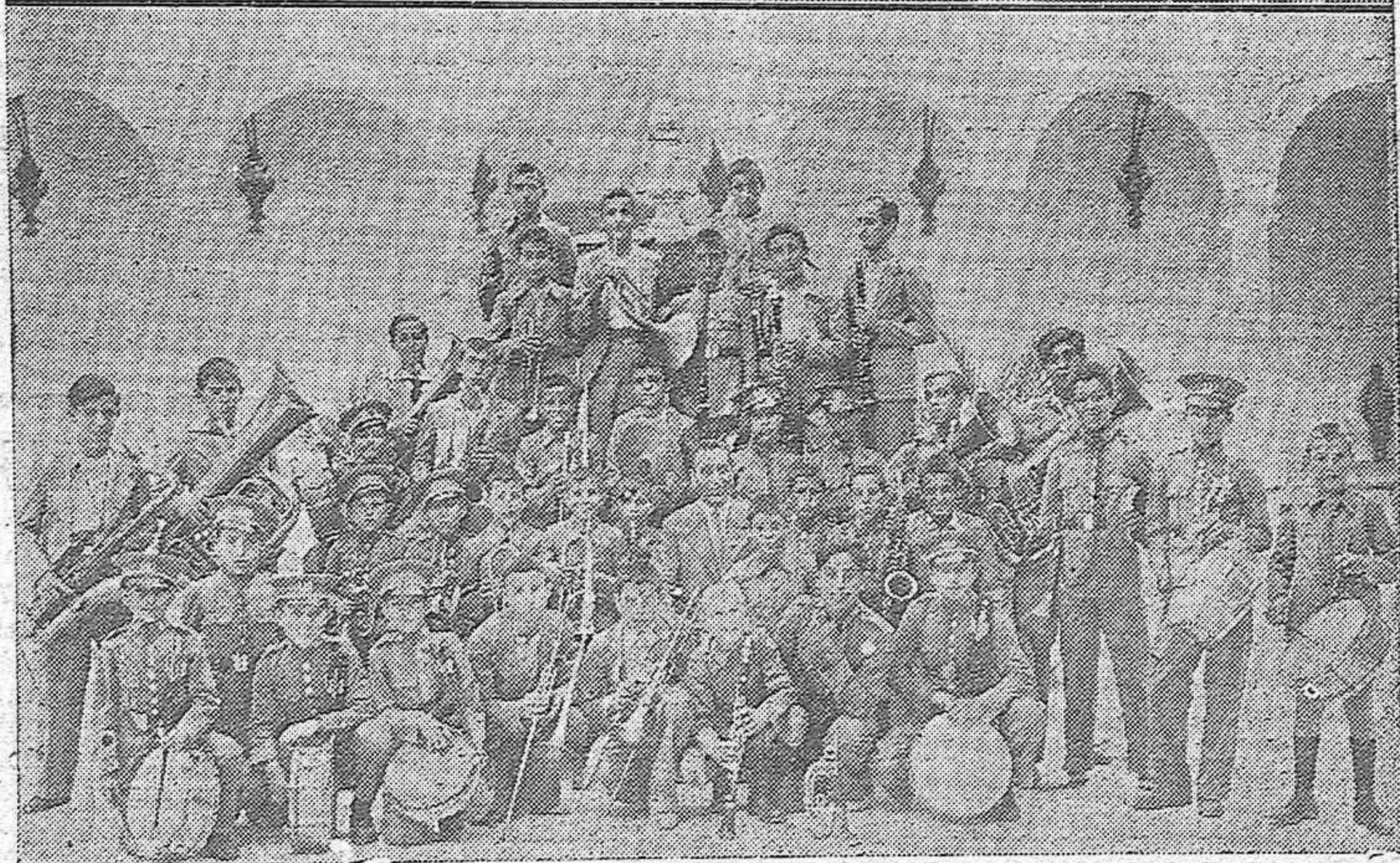
Arriba: Los niños asilados que forman la primera Colonia de Altura al salir para Cerro Muriano.—Abajo: La banda formada por hospicianos que dió un concierto con motivo de la despedida de sus compañeros.