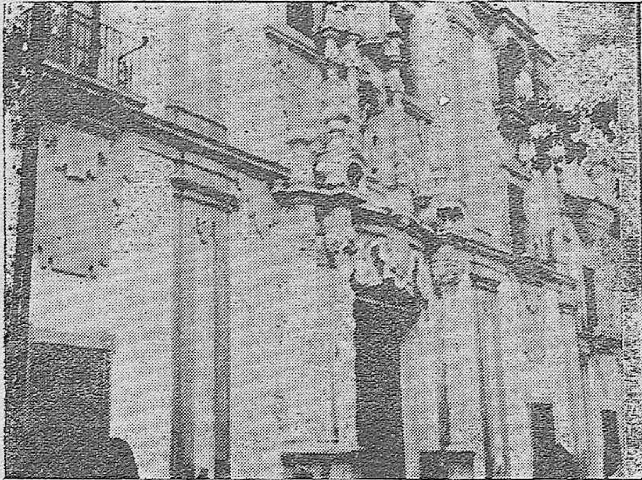
Puerta de entrada del antiguo Convento de la Merced (hoy Hospicio) donde la Reina Católica recibió a Colón para que éste hablara de su proyectado viaje