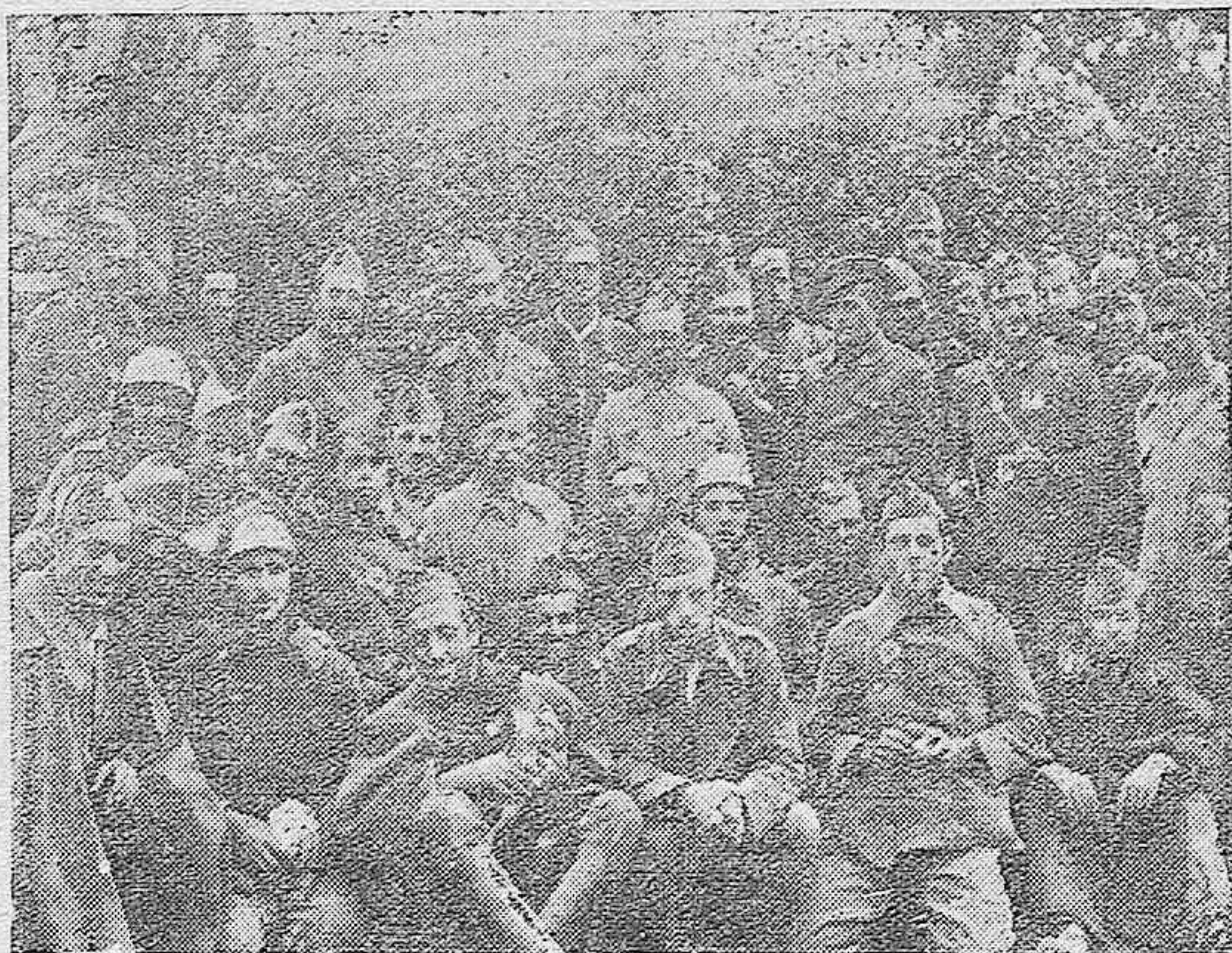
Grupo de artilleros en uno de los frentes de Córdoba