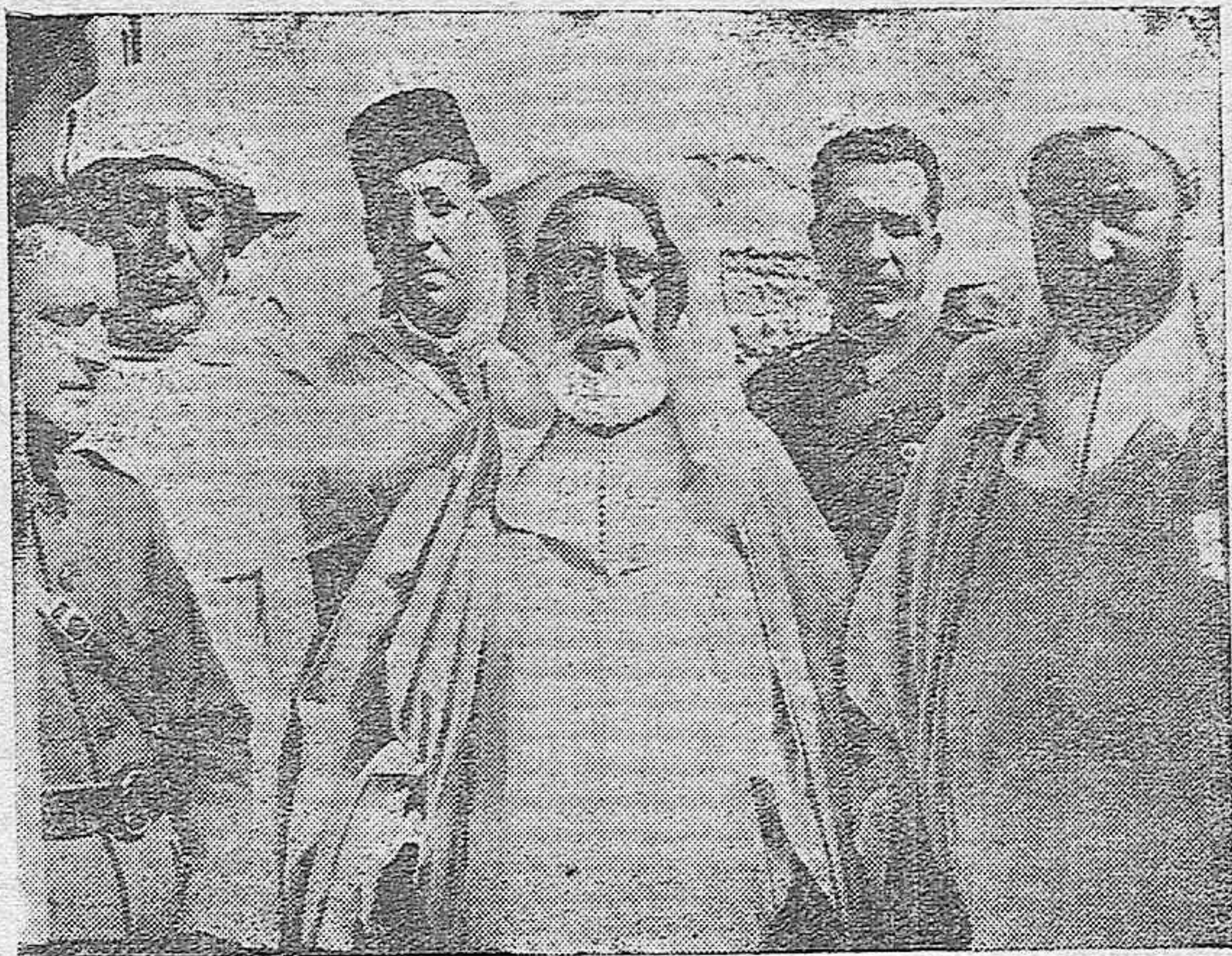
El Gran Visir contempla a Córdoba, el antiguo Califato, desde uno de los balcones de la Mezquita-Catedral.