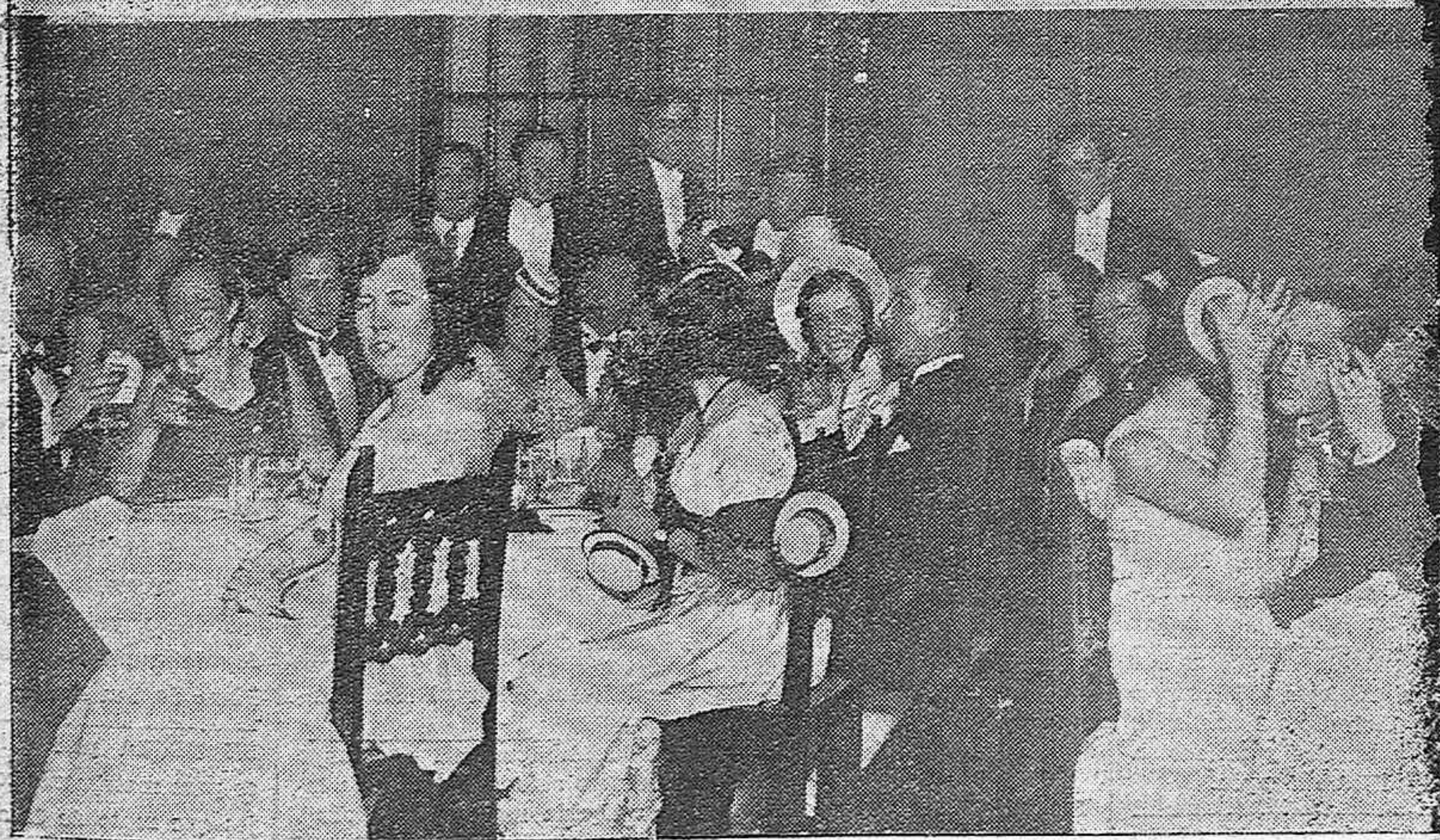
LA CENA CARNAVALESCA DEL TENNIS-CLUB.—Grupo de lindas señoritas que concurren caprichosamente disfrazadas.—Un aspecto del comedor del Regina durante la cena a la americana.