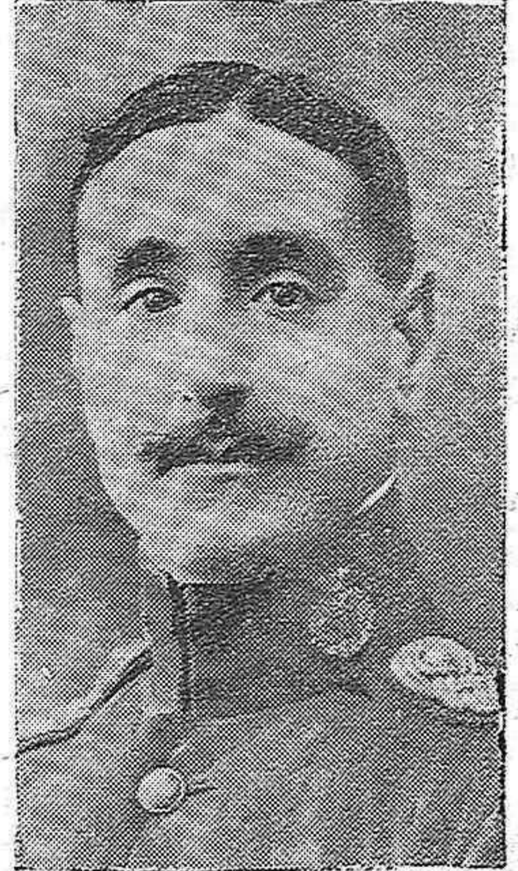
El capitán Galán, fusilado a consecuencia de los sucesos de Jaca

Camas niqueladas, doradas y colores de esmalte, construcción esmerada. Avenida de Canalejas, 20, Miró.