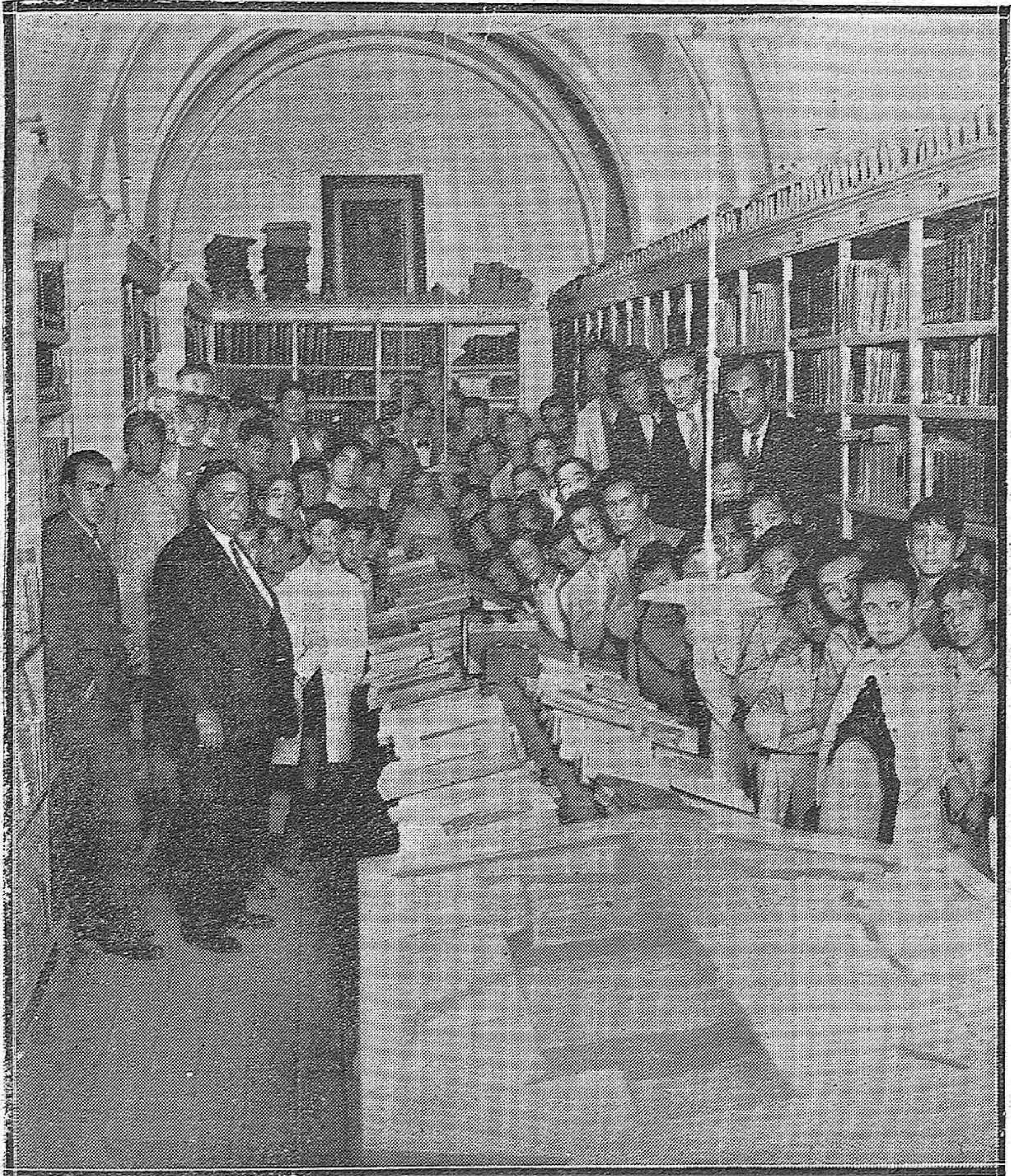
LA FIESTA DEL LIBRO.—ESTUDIANTES QUE ASISTIERON AL ACTO DE LA DONACIÓN DE LIBROS Y A LA CONFERENCIA QUE DIÓ EL CATEDRÁTICO DEL INSTITUTO D. MANUEL CAMACHO EN EL SALÓN-BIBLIOTECA DEL MENCIONADO CENTR. GOBIERNO