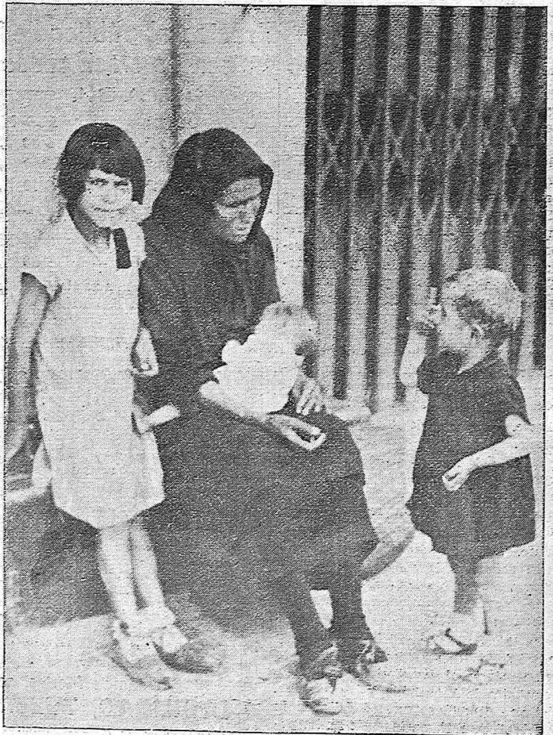
El pequeño infante, perfectamente instruido en el arte de pedir, rinde a la madre desventurada, la cuenta de su jornada, a la par que sus hermanitos.

Estos explotadores deben ser perseguidos con tenacidad por los agentes de la autoridad para que no sigan con su infame negocio que de manera desahogada les permite la continuidad de su vivir, pues para ellos lo de menos es el comer. No pocos