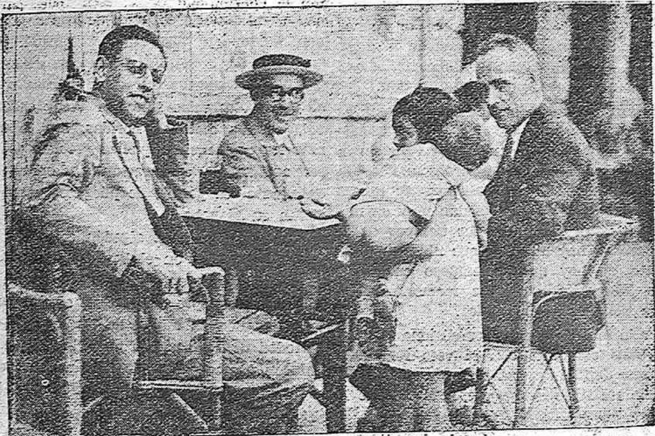
¡Una limosnita, señorito que no tengo padre y mi madre está malita en el hospital!...