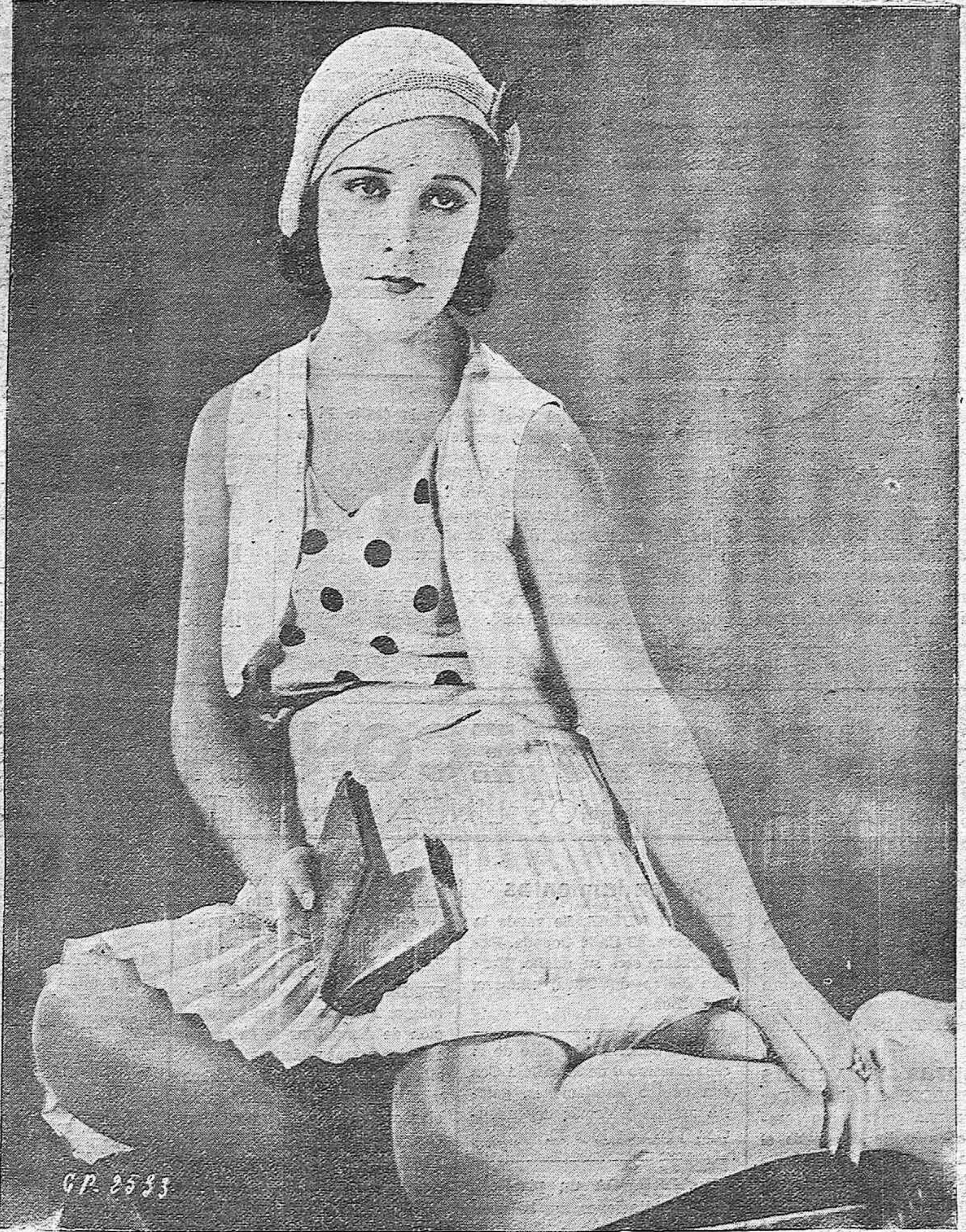
Imperio Argentina "La novia del Rajah", protagonista de la "Costa Azul". Paramount