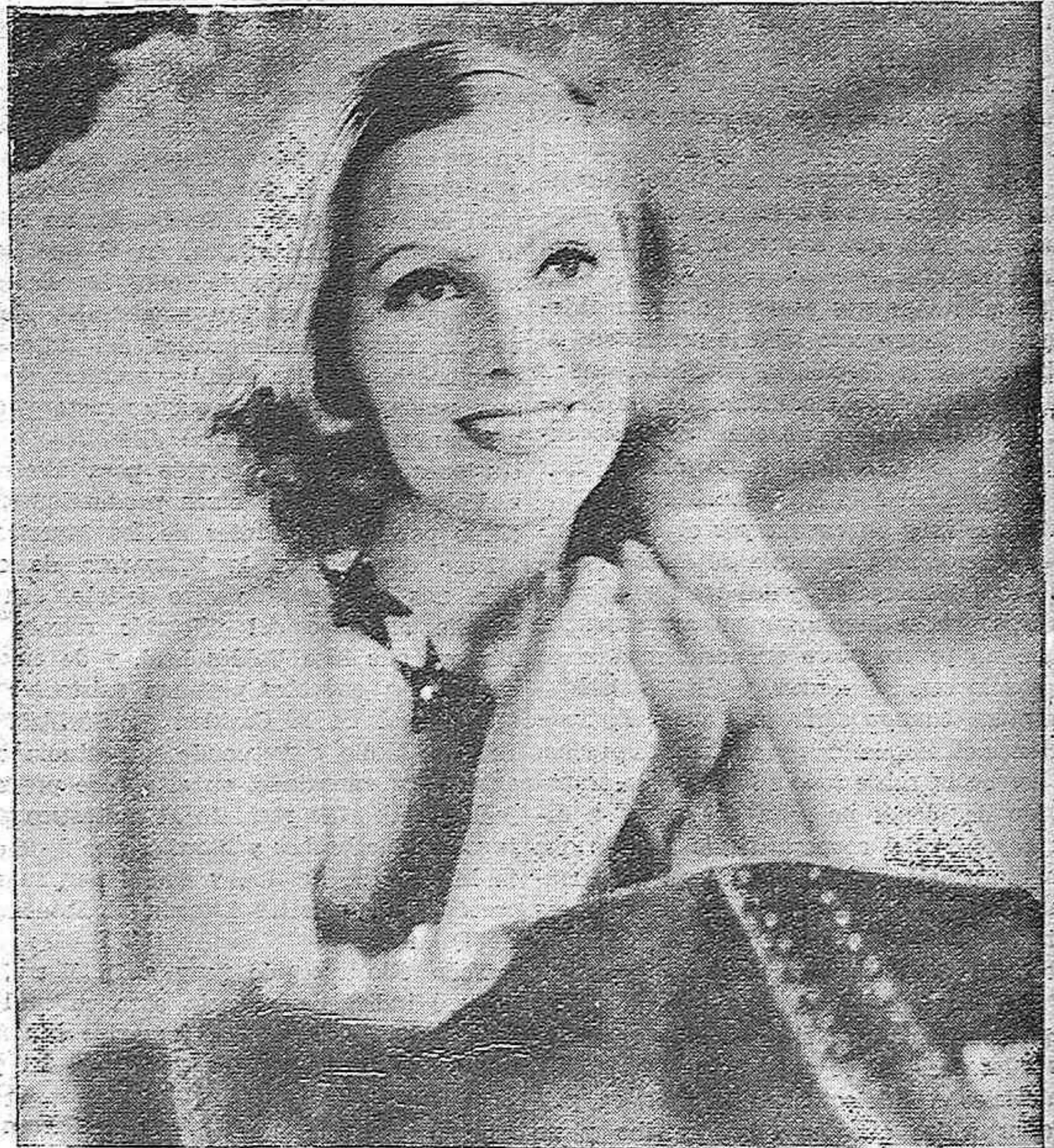
Greia Garbo se prepara para "El regreso del amado"... en una escena de su nueva producción para la Metro-Goldwyn-Mayer.

Pero por muchos que fueran sus pecados, son mayores sus virtudes, y esto es lo que debe tenerse en cuenta por encima de todos los apasionamientos y de todas las conveniencias pueblerinas.