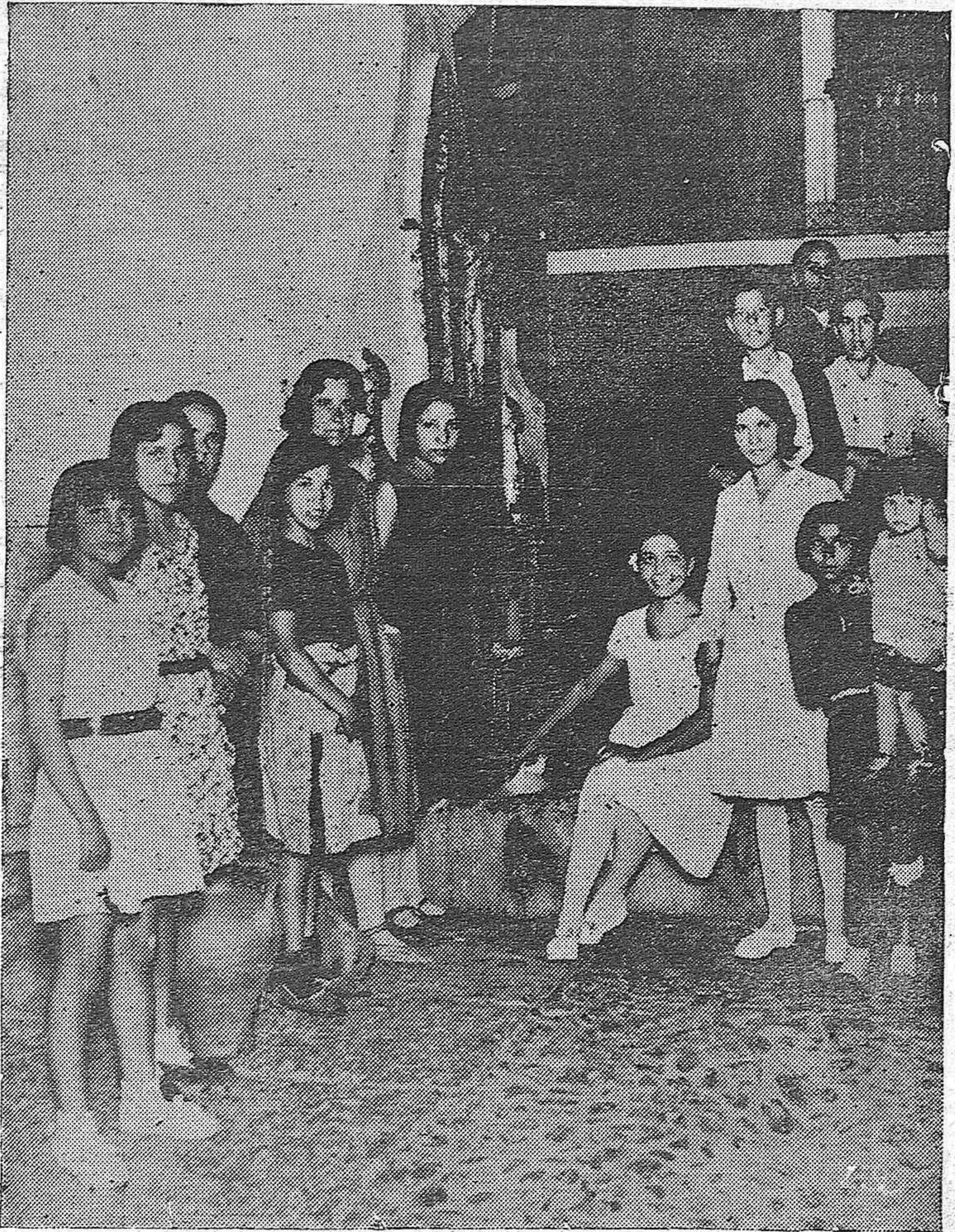
La artística Fuente de la Fuensecca rodeada de muchachas del barrio, en espera de turno para poder llenar sus cántaros con el precioso y escaso líquido