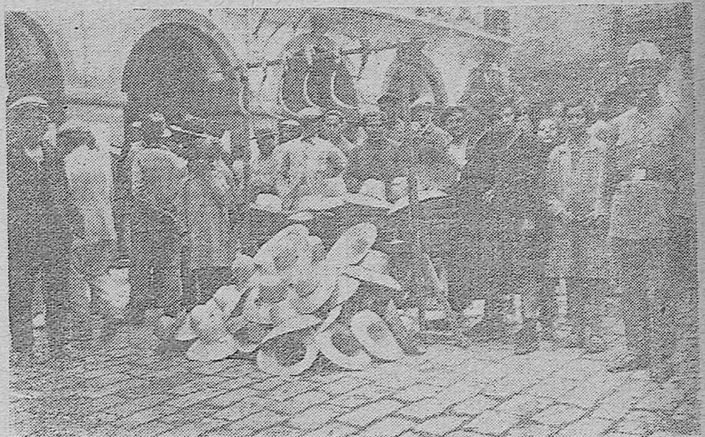
UN PUESTO DE «JIPIS» AL AIRE LIBRE