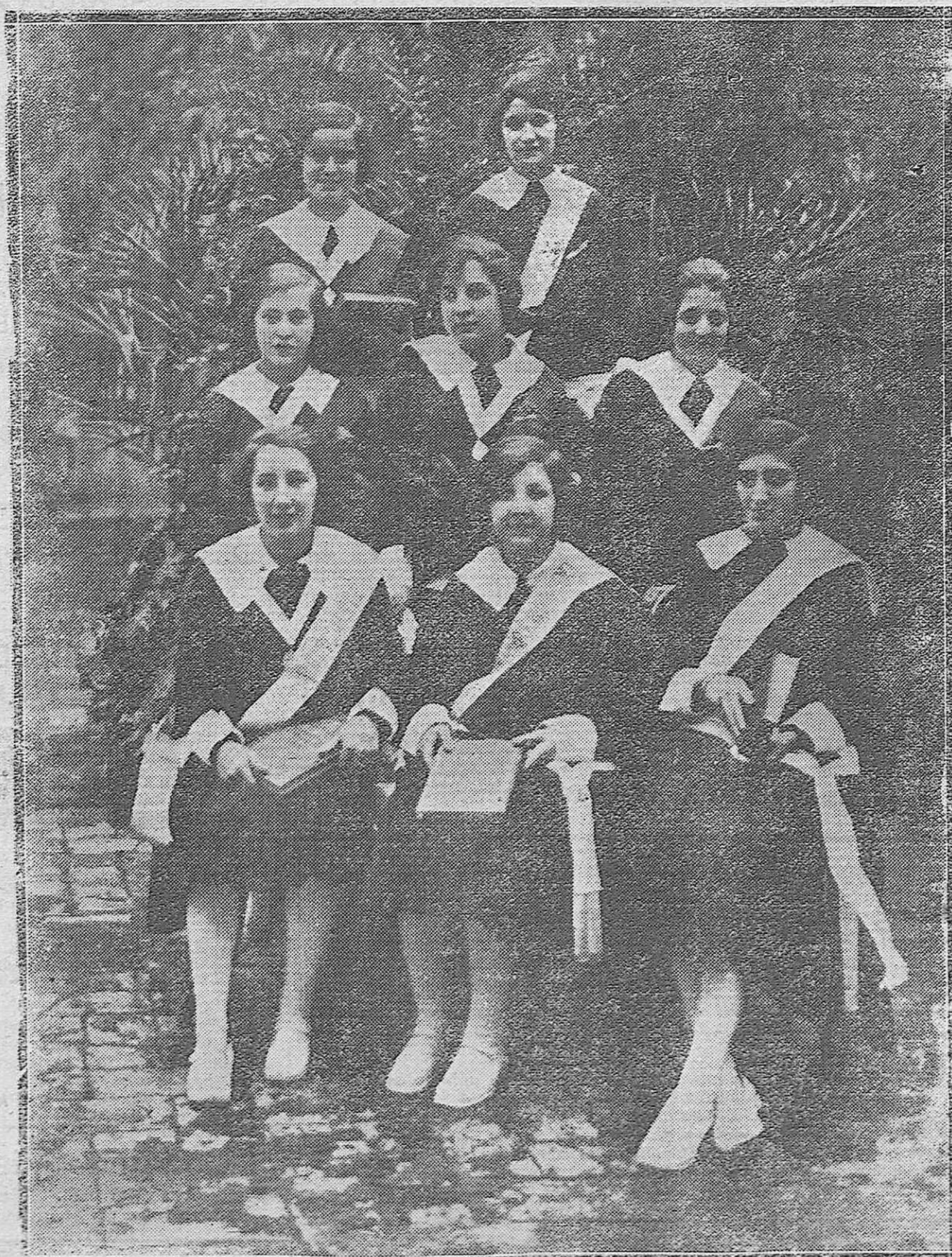
CÓRDOBA.--Grupo de alumnas del Colegio de Santa Victoria, que han obtenido Premio de honor en su respectivo curso.