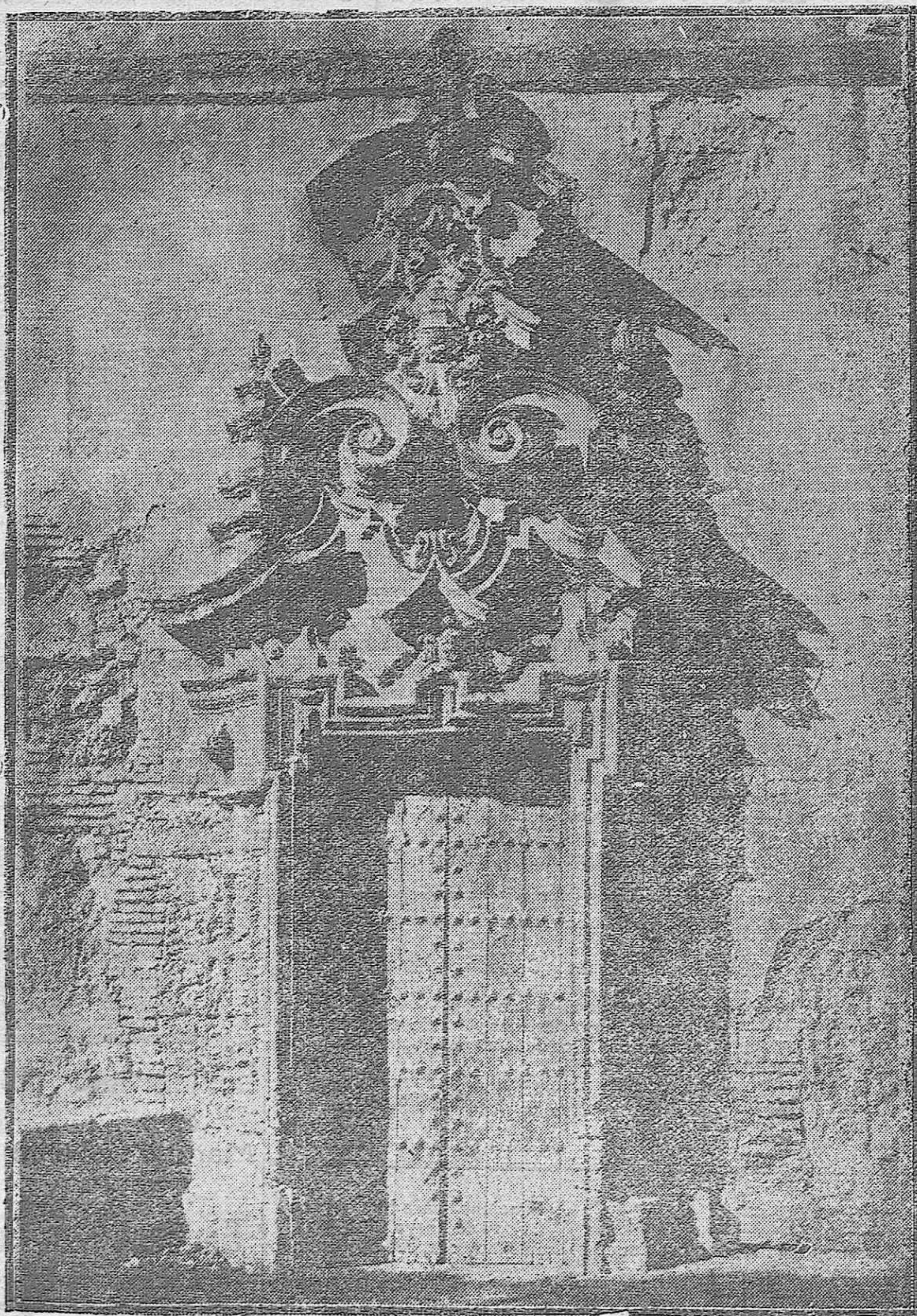
Puerta de los Aires de la Catedral, representación del más exagerado arte barroco