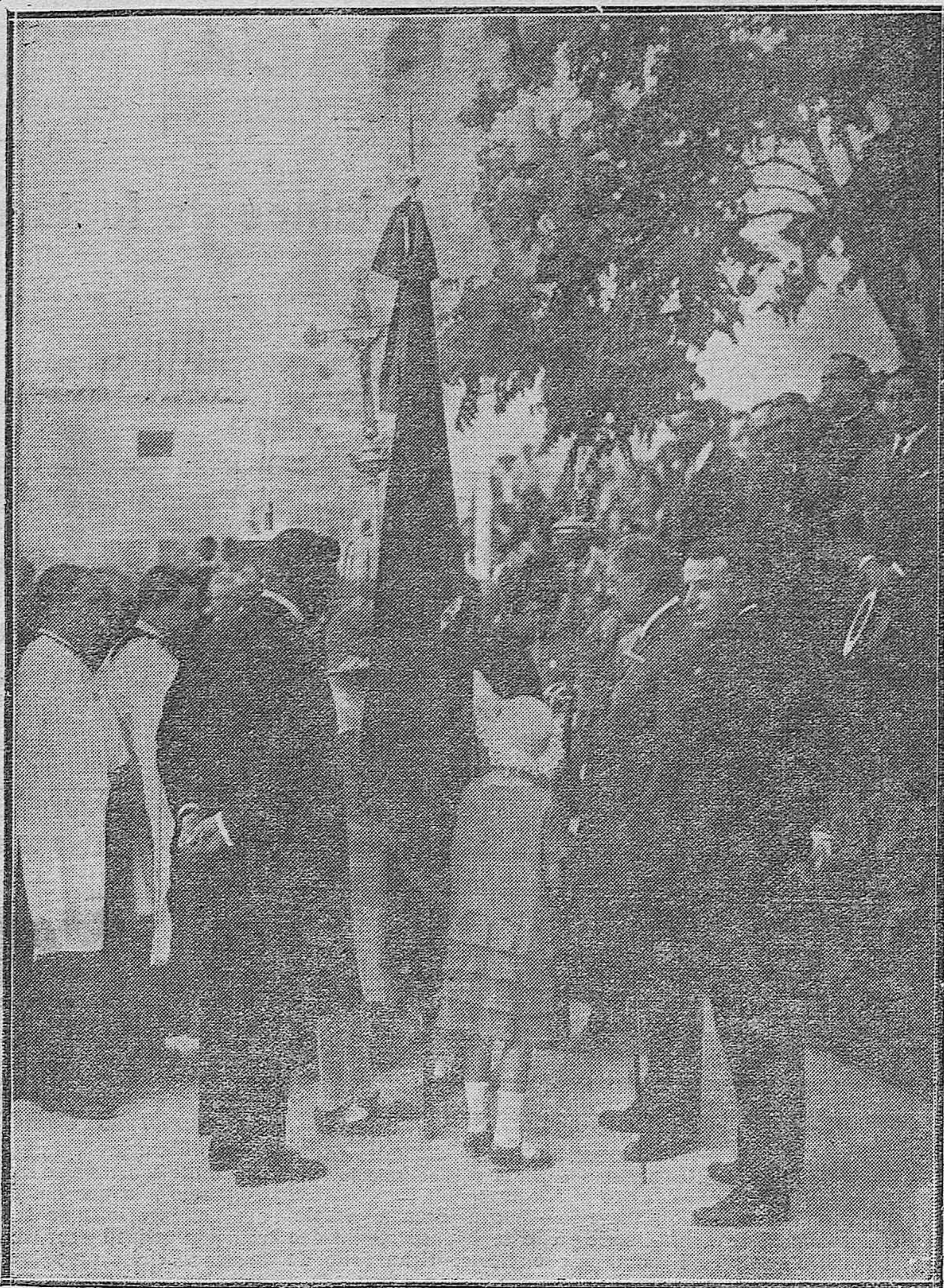
LUQUE.—MOMENTO DE SER BENDECIDA LA BANDERA DEL SOMATEN POR EL PÁRROCO DEL PUEBLO A PRESENCIA DE LAS AUTORIDADES.