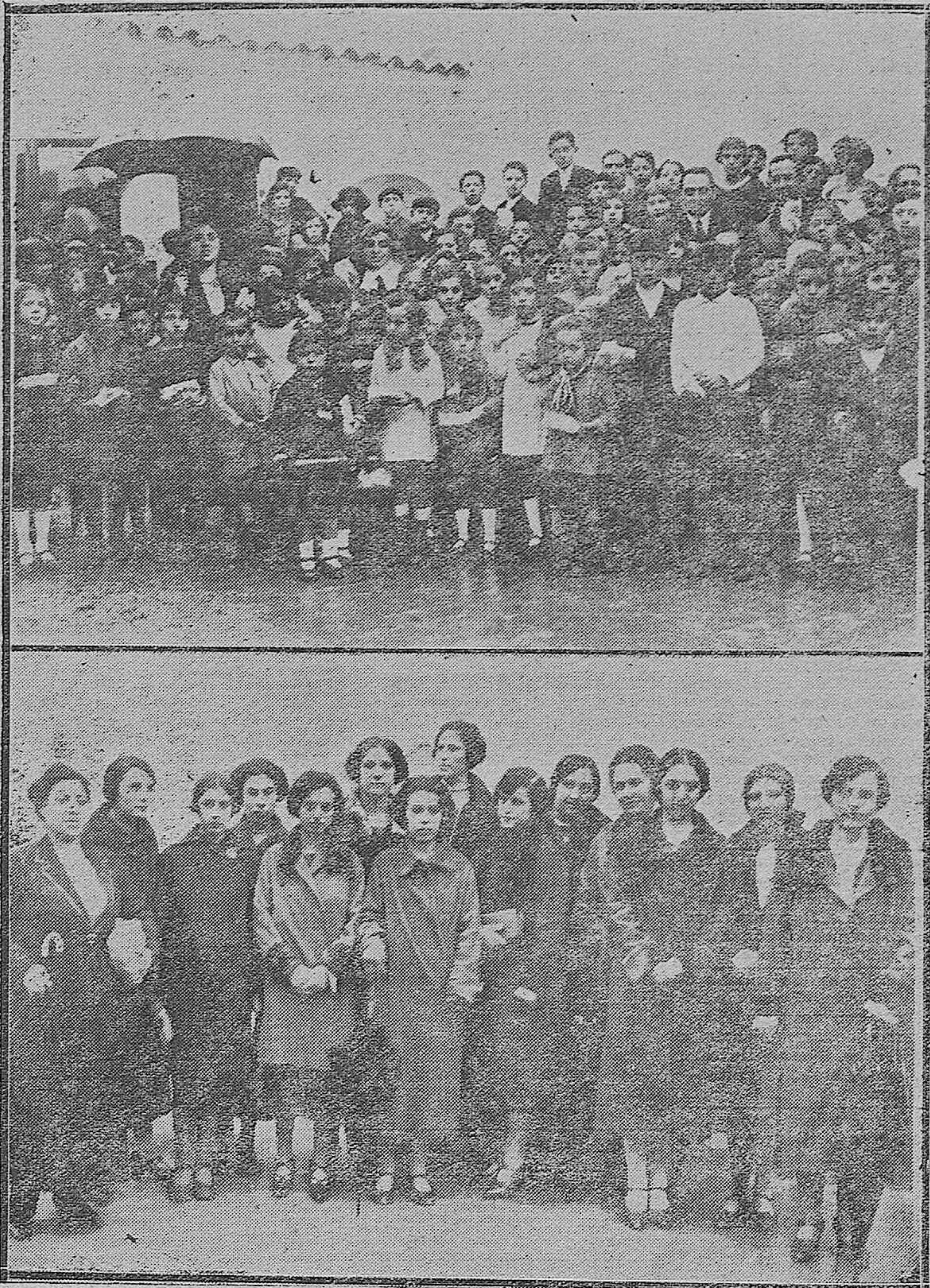
ALMODOVAR DEL RIO.--El alcalde de dicha villa con el director de la Compañía Telefónica Nacional después del reparto de meriendas a los niños de las escuelas.--Distinguidas señoritas de la localidad que hicieron la distribución de las meriendas.