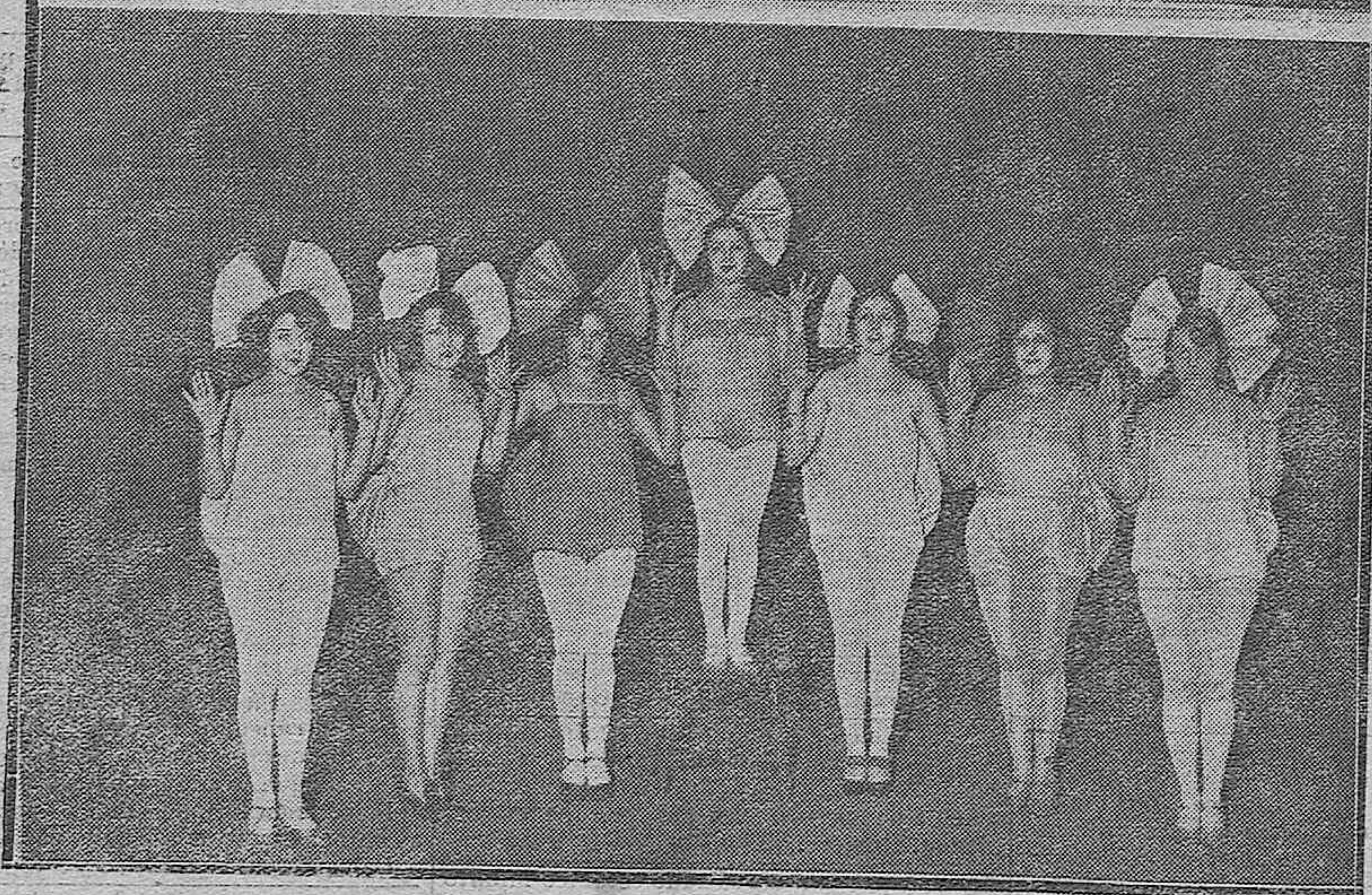
ACTUALIDAD TEATRAL.--La agrupación artística denominada "Frivolidad", notable número de variedades que anoche hizo su presentación en la Plaza de Toros con el beneplácito del público.