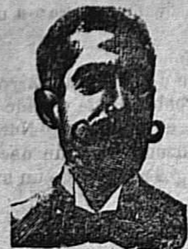
A. SALVATI COSTANZI Calle Diputación, 435.-Barcelona