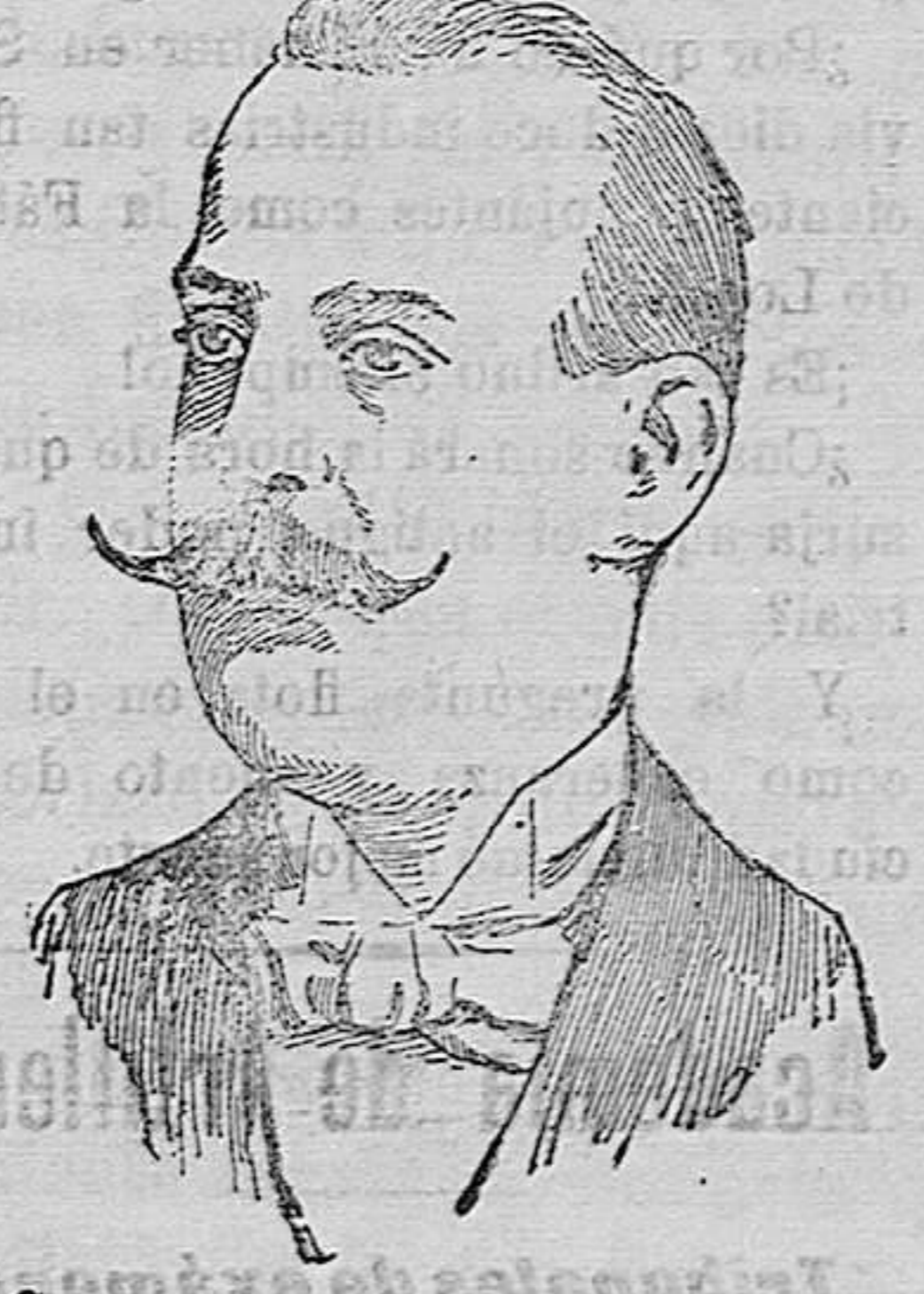
Cuya grave enfermedad hace temer un fatal desenlace, que influiría poderosamente en el actual conflicto europeo.