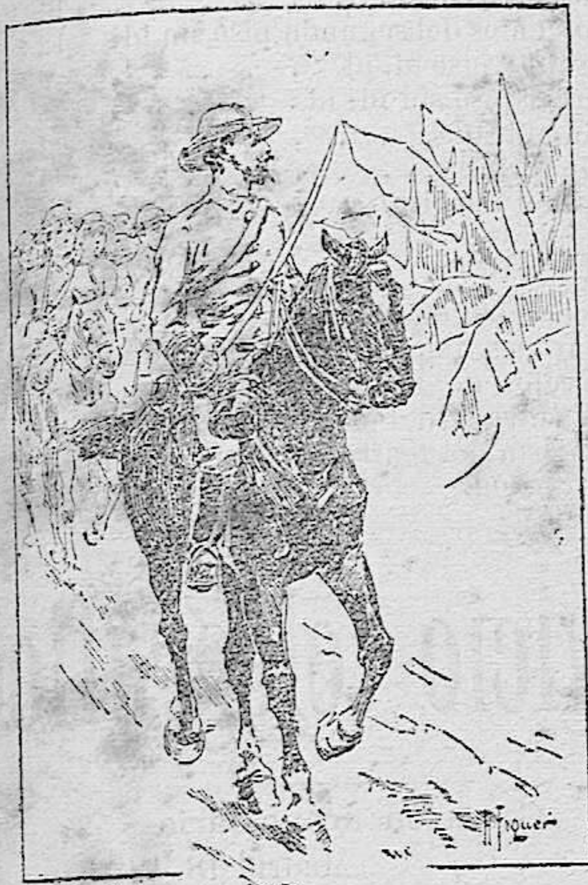
Caballería en marcha