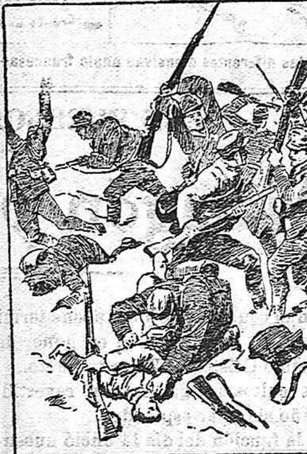
Un cuerpo á cuerpo entre soldados austro-italianos en Monte-Castón