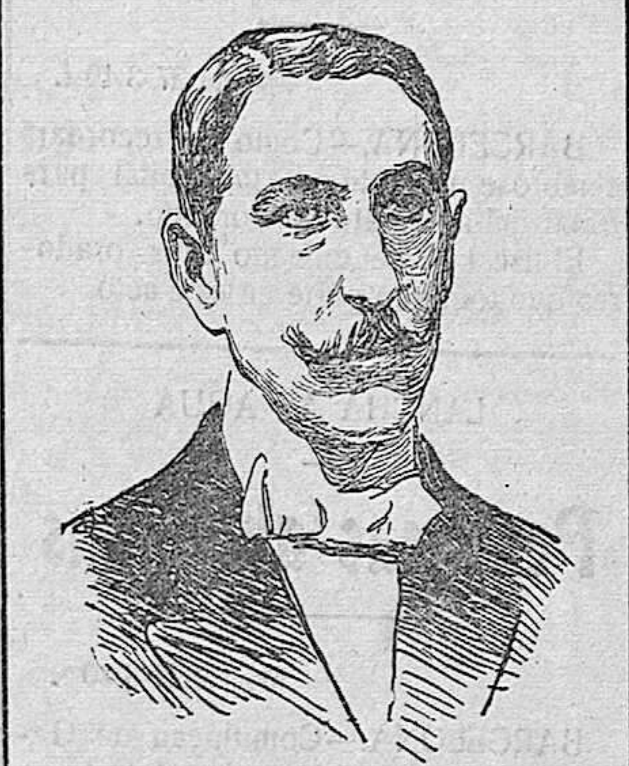
DON RAFAEL GASSET QUE DESEMPEÑA NUESTRA VACANTE LA CARTERA DE FOMENTO

á quienes se ha hecho justicia seca y espontánea, sin valedores ni padrinos! Aparte todas esas consideraciones, la recomendación por el daño que al individuo y á la sociedad ocasiona debiera negarse.