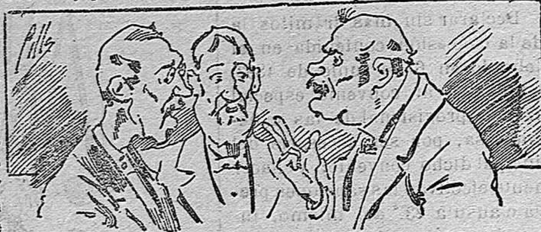
Abominan á nuestros libros....., pero los compran.

Todas las personas de gusto, curiosas é ilustradas deben pedir al Director de LA AVISPA, apartado núm. 8, MADRID, un ejemplar que se remite gratis y franqueado. Esta Revista Enciclopédica Popular publica recreaciones científicas, recetas de cocina, repostería, confitería, vinos, licores, pinturas, barnices, betunes y fórmulas para toda clase de industria, y cuantas noticias y conocimientos puedan ser beneficiosos. Cuenta además con buenos grabados, parte literaria excelente; da regalos mensuales á sus lectores con la Lotería Nacional y participaciones en la misma, á cuyo efecto compra todos los sorteos, y en una de las Administraciones más afortunadas por la suerte, billetes enteros. La suscripción y los números que se nos pidan se sirven gratuitamente á correo vuelto y franqueados, con sólo indicar el nombre y dirección del que lo desea en sobre dirigido al Sr. Administrador de