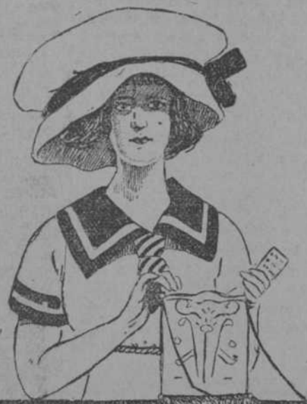
LA QUE HACE EL GASTO