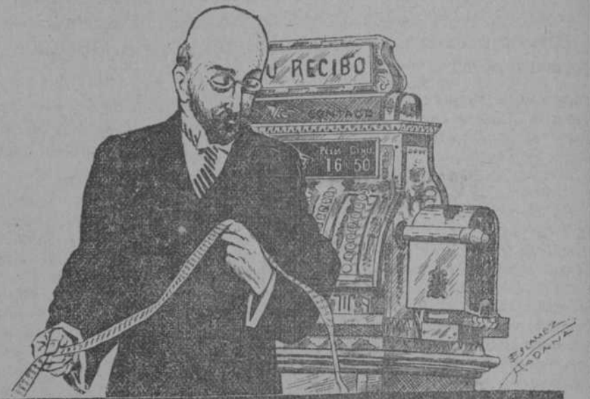
EL QUE HACE EL NEGOCIO