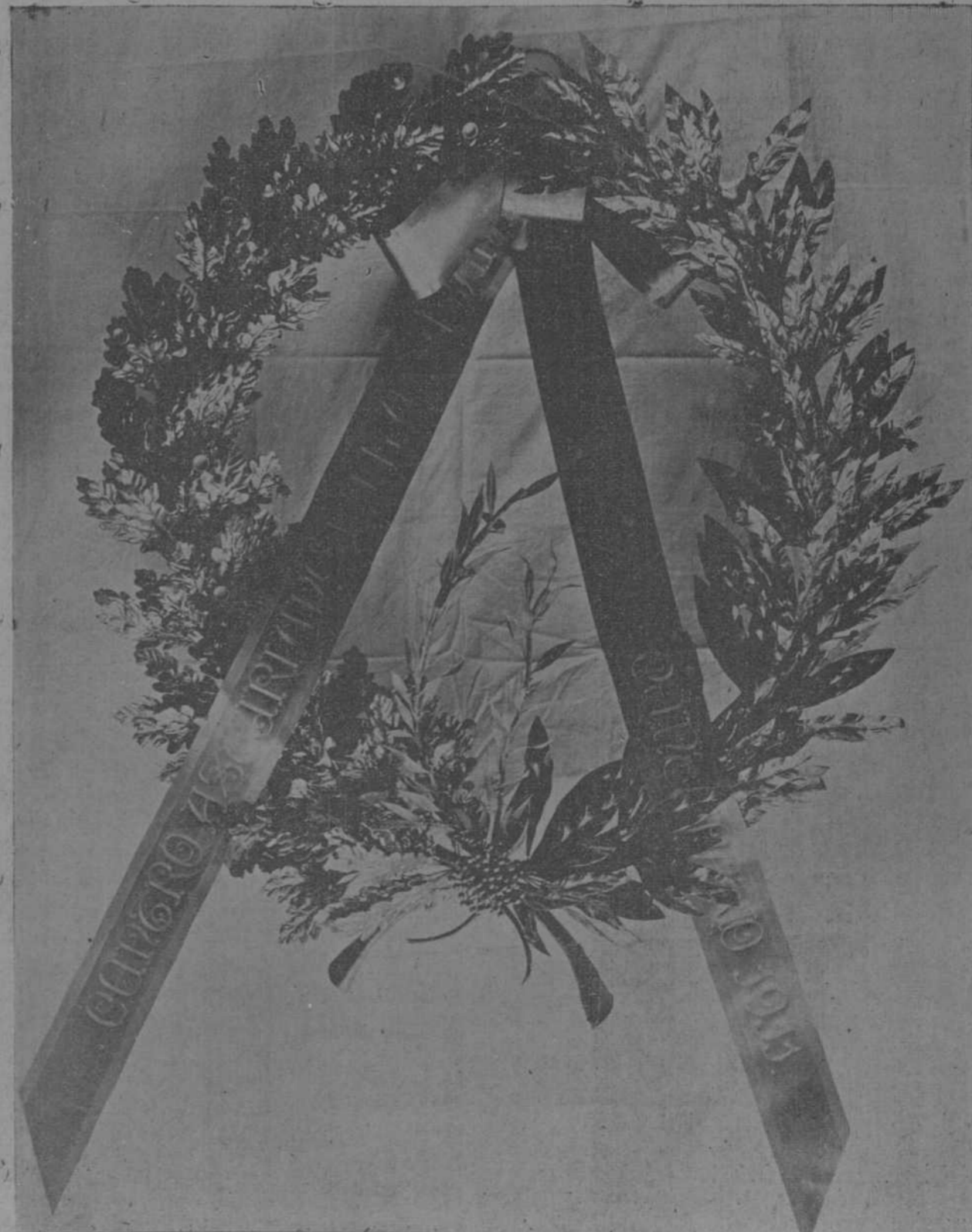
Manífica corona de bronce, ofrenda del CENTRO ASTURIANO de la Habana á Jovellanos, con motivo del Centenario celebrado con gran solemnidad en Gijón.