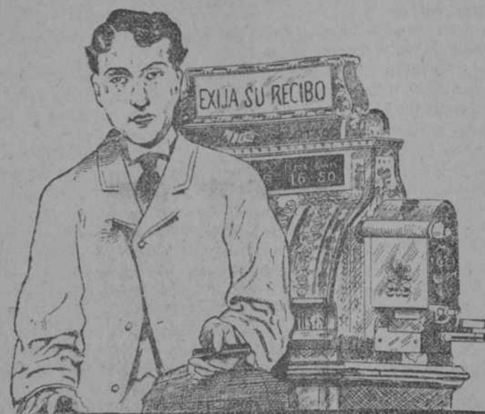
EL QUE HACE EL DESPACHO