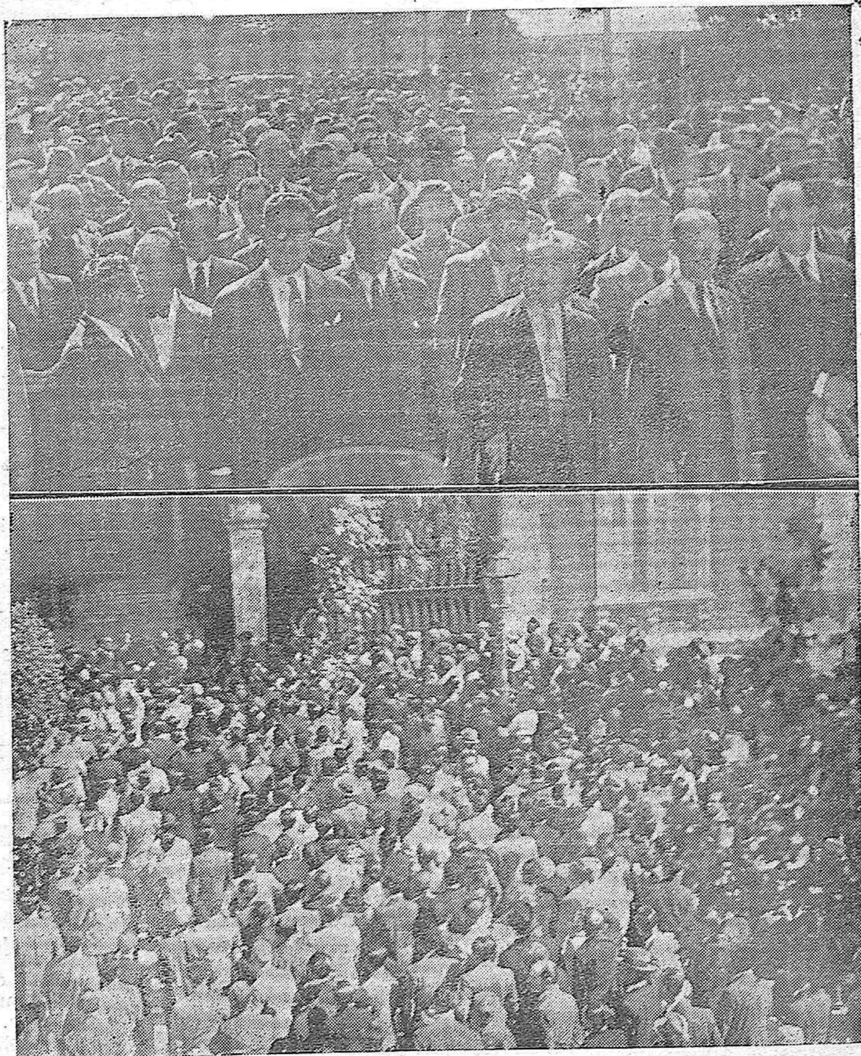
La manifestación patriótica de ayer.—Presidencia de la manifestación a su paso por la Avenida del Gran Capitán.—Los manifestantes oyendo la arenga del gobernador señor Gardoqui.