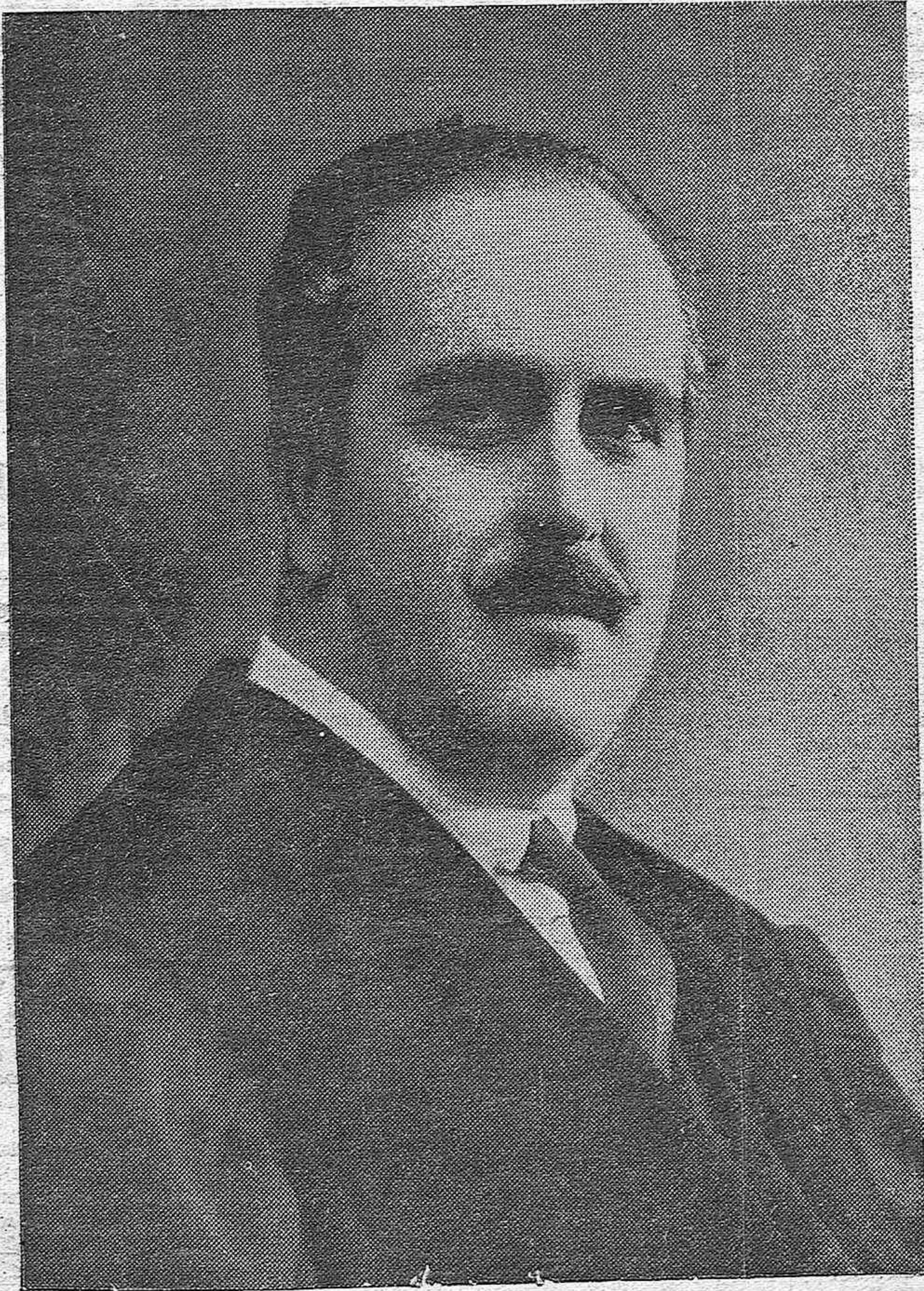
DON ELOY VAQUERO CANTILLO, federal autonomista