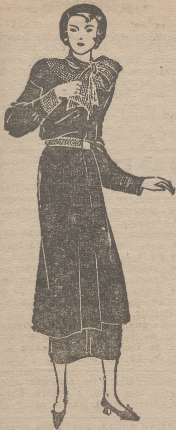
Conjunto de "marrocain" negro. Abri- go "tres cuartos". Tiene un canesú anudado adelante. Cuello, puños y cinturón respuntado.

por dos valores con marca sexual. El valor del ama española de pueblo es económico, es decir, político, masculino. La mujer nueva, más o menos feminista aún sin saberlo, rechaza el feminismo matriarcal no por galante, no por el poder que supone del sexo sino por familia, por la forma social que representa, en definitiva por nuevo sentido político. La mujer quiere otro trabajo.