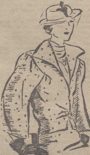
Chaqueta de lana de angora color crema. Sobre una falda de lanilla castaño.