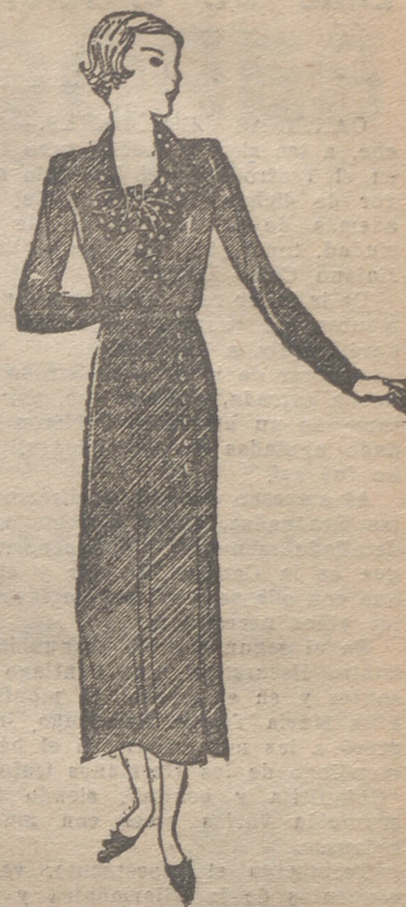
Traje de lana gris, avivado con un "foulard" rojo con puntos blancos, pasado por el cuello y anudado adelante. Botones del mismo tejido.

Disponemos de las mejores pastas dentífricas especiales para comunicar a sus dientes una brillantez extraordinaria. Perfumería VIUDA DE ELIZONDO. TELEFONO 1758