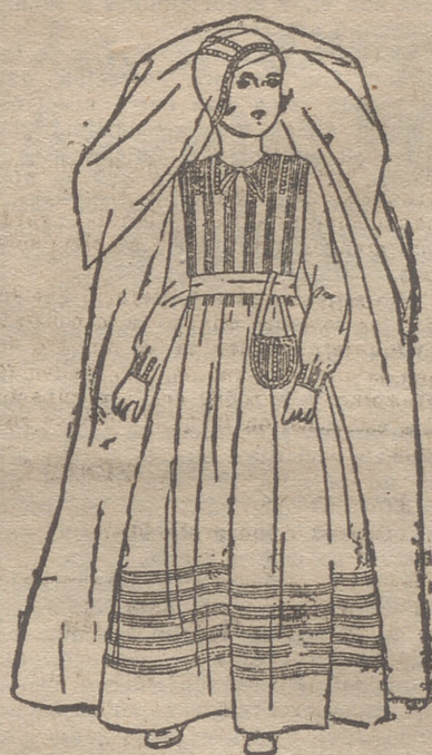
Traje de primera Comunión, adornado con pequeños grupos de pliegues de lencería y vainicas, así como el llimonero y el gorrito.

Después de rallar la mitad de la cáscara de naranja, se mejan en el mortero las ralladuras con una cucharadita o un terrón de azúcar, "glas" que