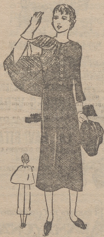
Trajecito de lana azul, abotonado adelante, así como la capita que lo completa.

A la mañana siguiente, muy temprano, viene a despertarla su criada,