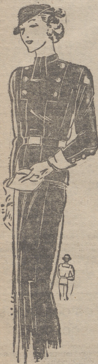
Traje de lana azul marino, adornado con recortes y el pecherín blanco.