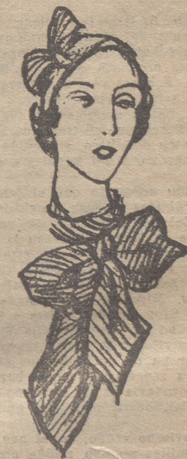
Toca y corbata en tejido a rayas grises y negras.

Os lo recomendamos especialmente para los cuartos de los niños, a quienes evitarán por su bien repartida claridad, esos contrastes violentos de luz tan perjudicial, desde el punto de vista fisiológico.