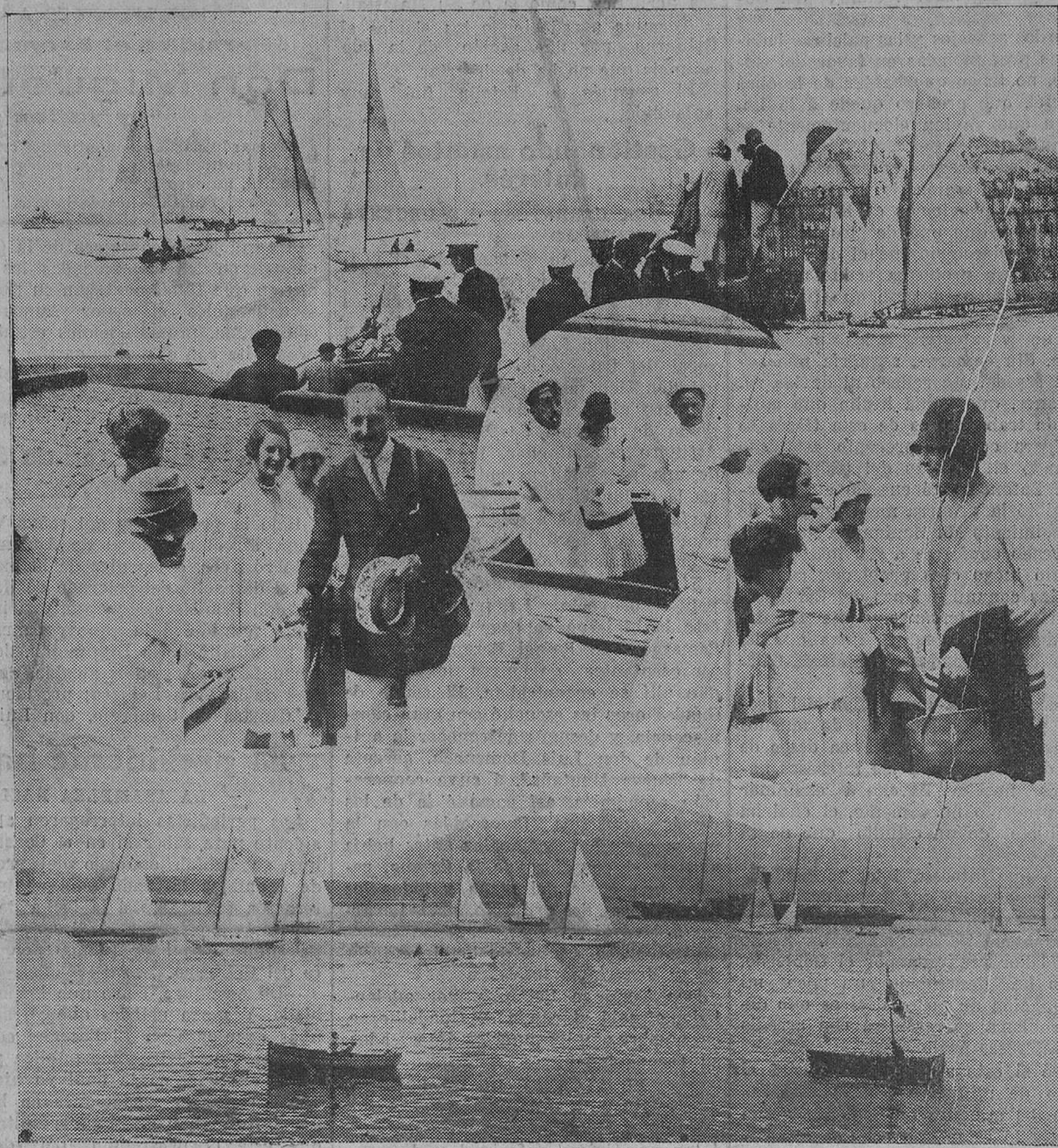
DEL PRIMER DIA DE REGATAS.—La bahía ofrecía ayer un pintoresco aspecto por la cantidad de balandros que se presentaron a la primera prueba oficial, celebrada ayer.—Su Majestad el Rey, al llegar al embarcadero, saludando a los balandristas.—Don Alfonso patroneando su balandro "Hispania IV".—La Reina doña Victoria saludando a las señoritas que tomaron parte en la prueba de ayer.—Momento de dar la salida a los balandros de seis metros.

Durante la comida, la orquesta del Hotel, situada a la entrada del comedor, ejecutó un escogido concierto.