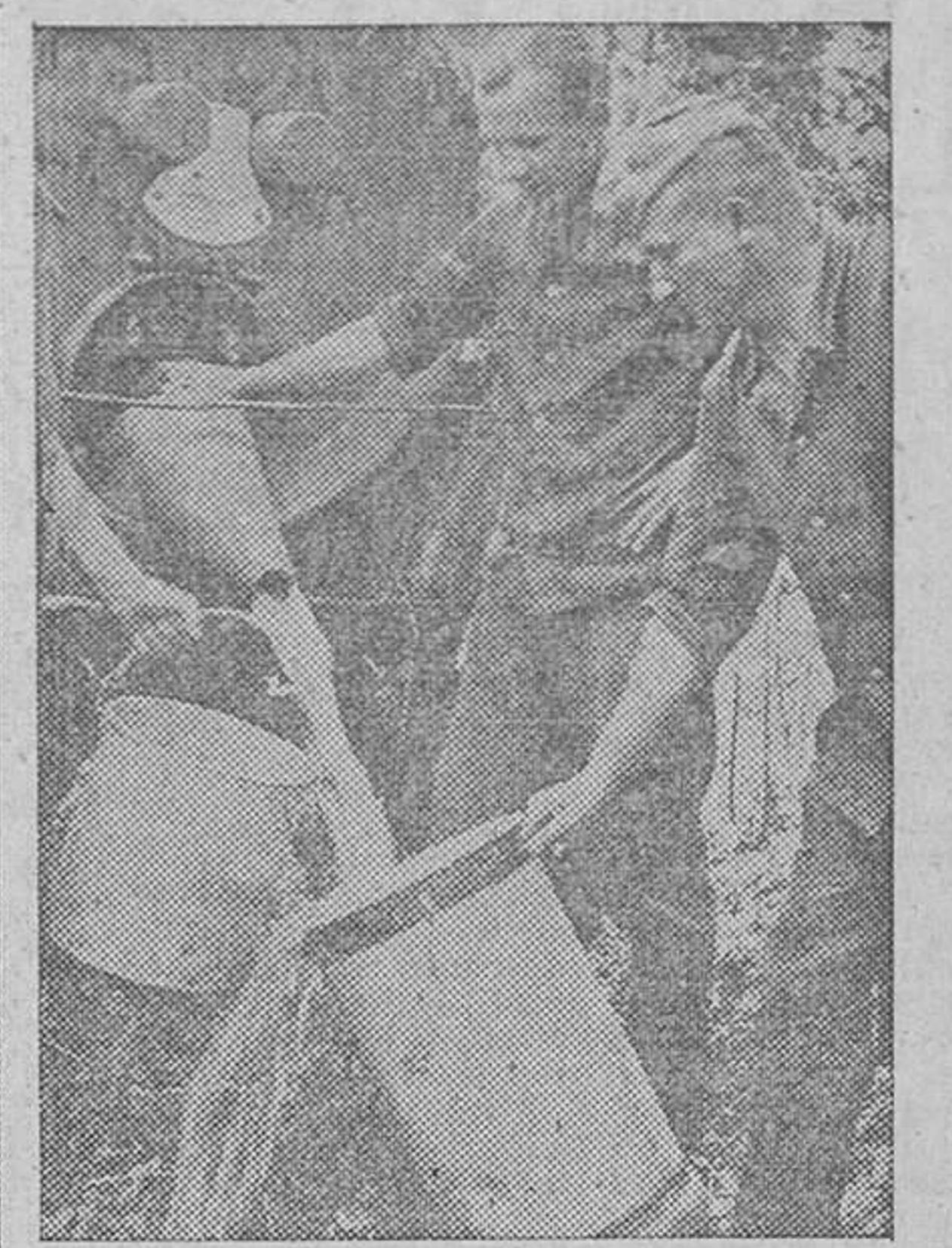
Suministro de agua al Ejército, por medio de aparatos especiales que garantizan la potabilidad