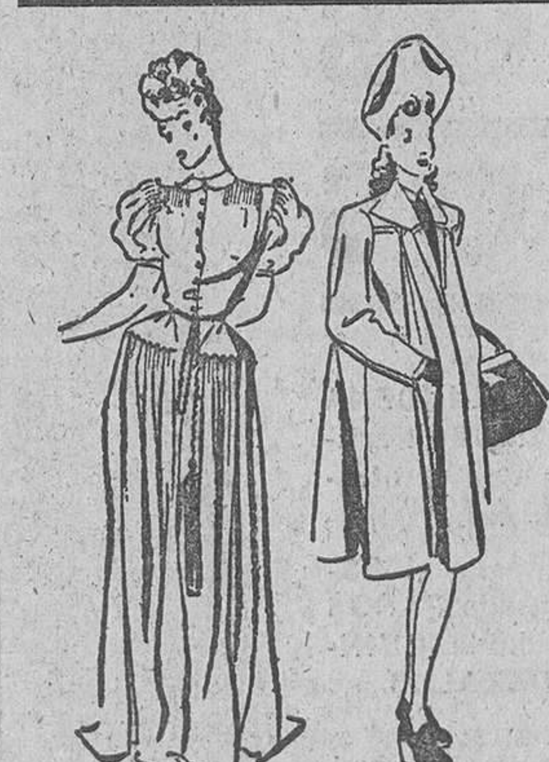
Elegante y sencillo vestido de tarde en seda natural. Lleva cinturón muy ancho de ante blanco.