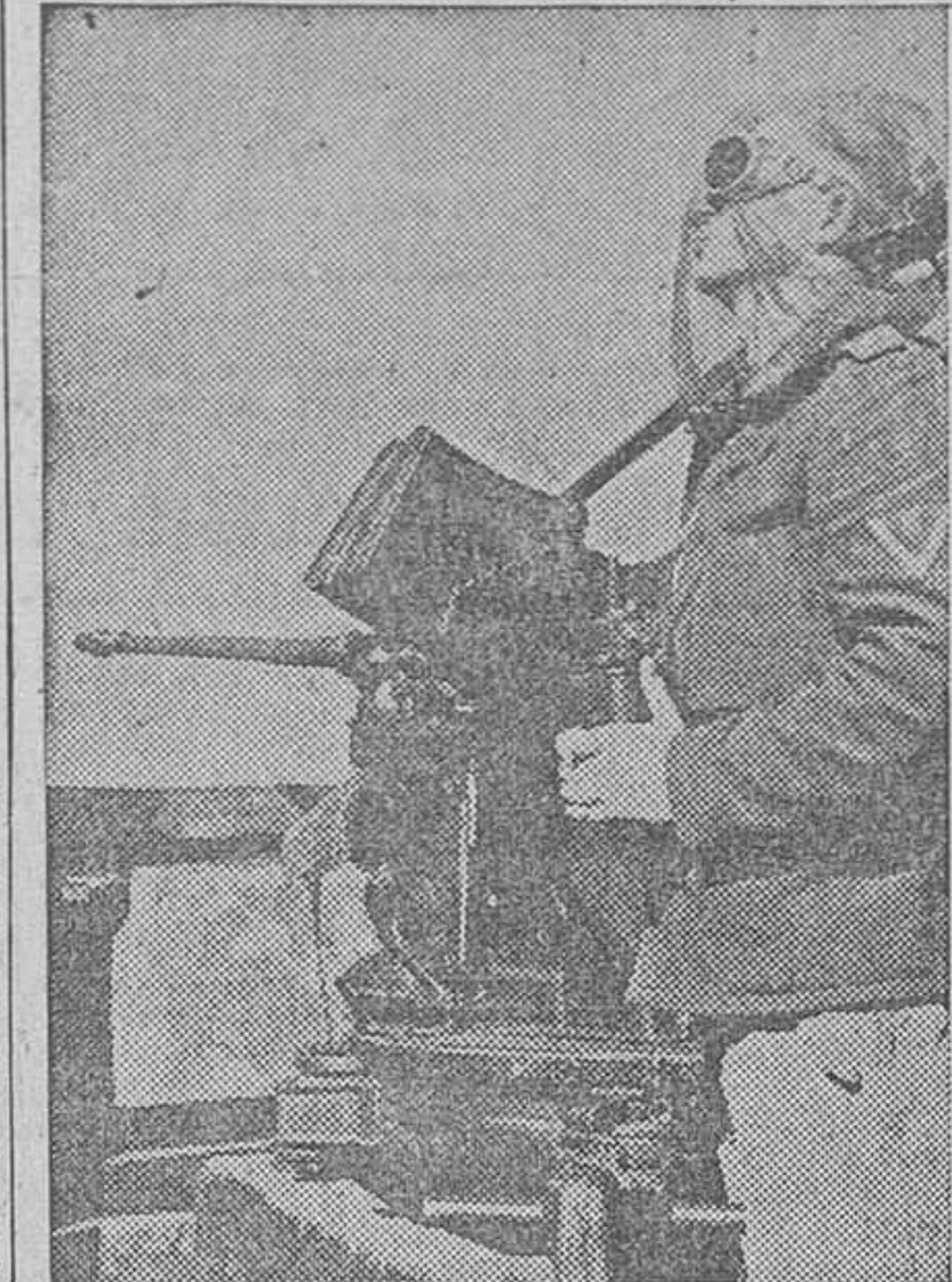
Defensa antiaérea alemana, provista del más moderno material