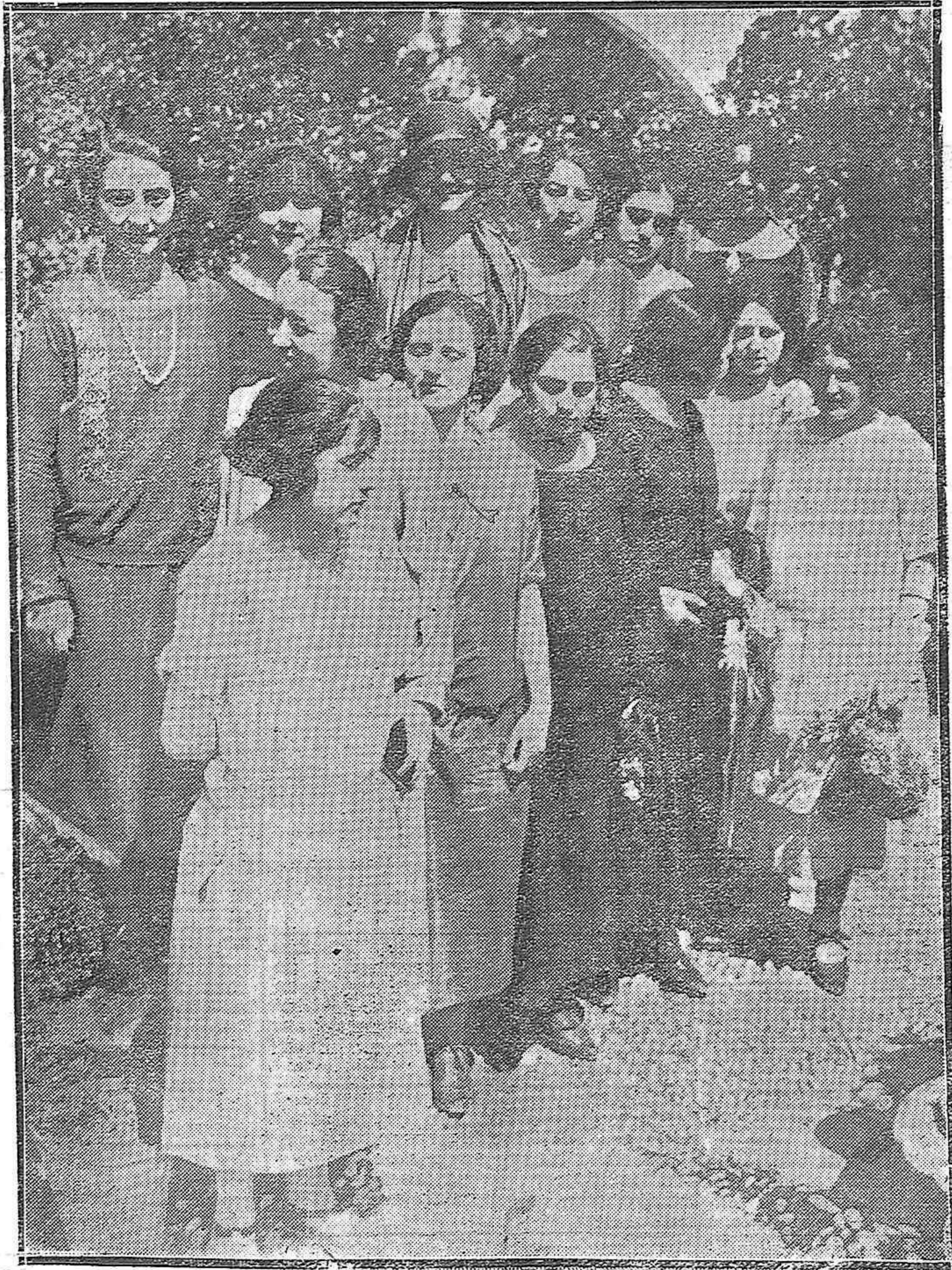
BELLAS JÓVENES ESTUDIANTES DEL SEXTO AÑO DEL INSTITUTO ESCUELA DE MADRID, QUE HAN VISITADO NUESTRA CIUDAD EN VIAJE DE PRÁCTICAS.