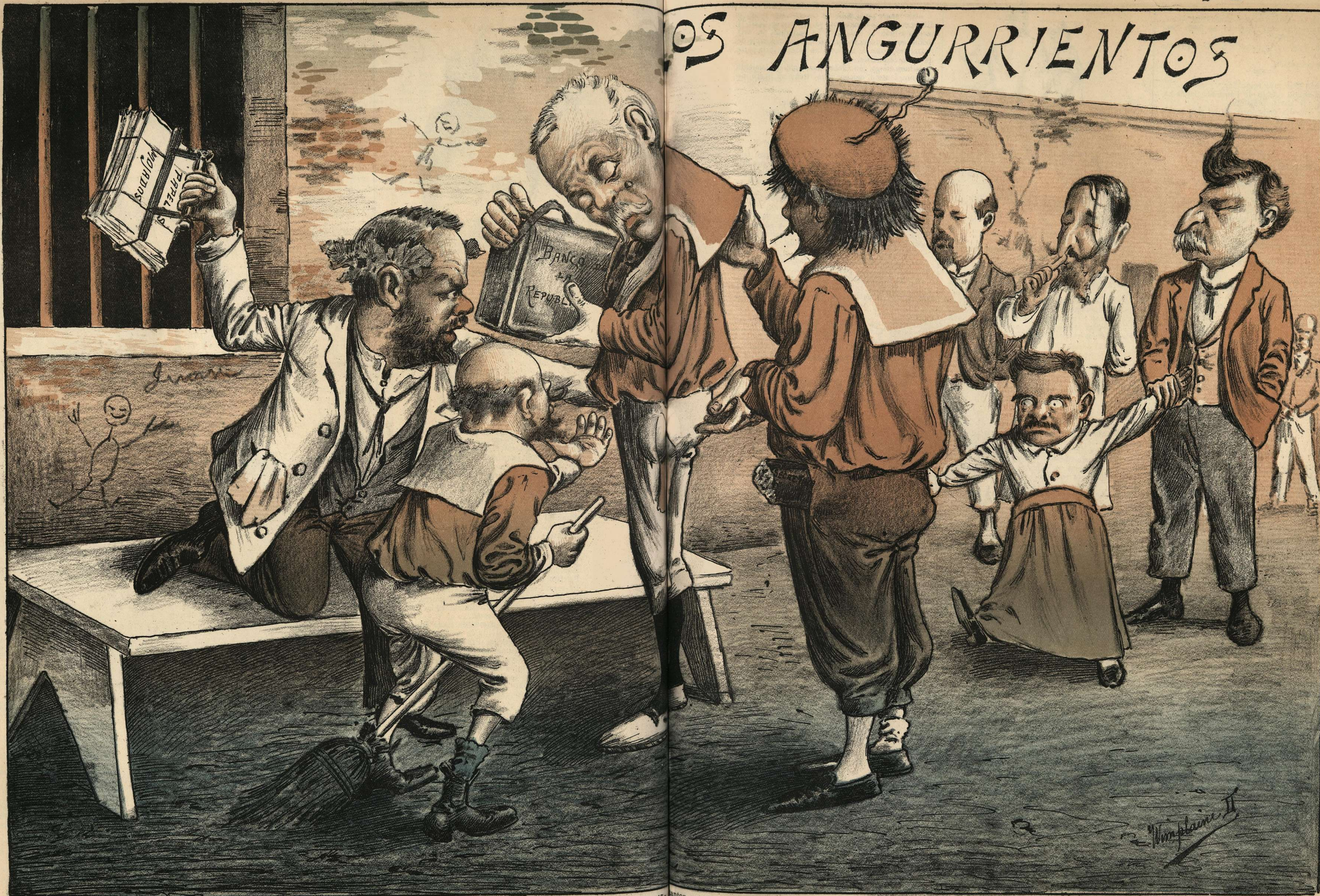
Antes que el pobre niño destape la canasta do lleva la merienda sabrosa y codiciada, los chicos pedigueros le acosan á pechadas de modo tal que temo no quede de ella nada, antes y tan voraces con los que echan ojeadas piden una parte de la ley de la tajada) de la merienda rica, sabrosa y codiciada, aún antes de que el niño destape la canasta.