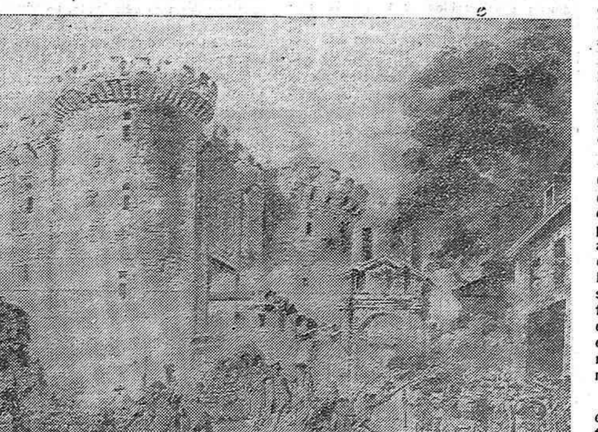
El poble de París assalta la Bastilla el matí del 14 de juliol del 1789, amb la qual cosa comença una nova era per a la humanitat.

Que la diada del 14 de juliol, gran diada de la humanitat, sigui progressiva, ens encengui la sang, ens aclareixi el pensament i ens doni força al braç per a lluitar el gran combat decisiu que amb la nostra unitat hem de donar contra el feixisme amb etiqueta espanyola!