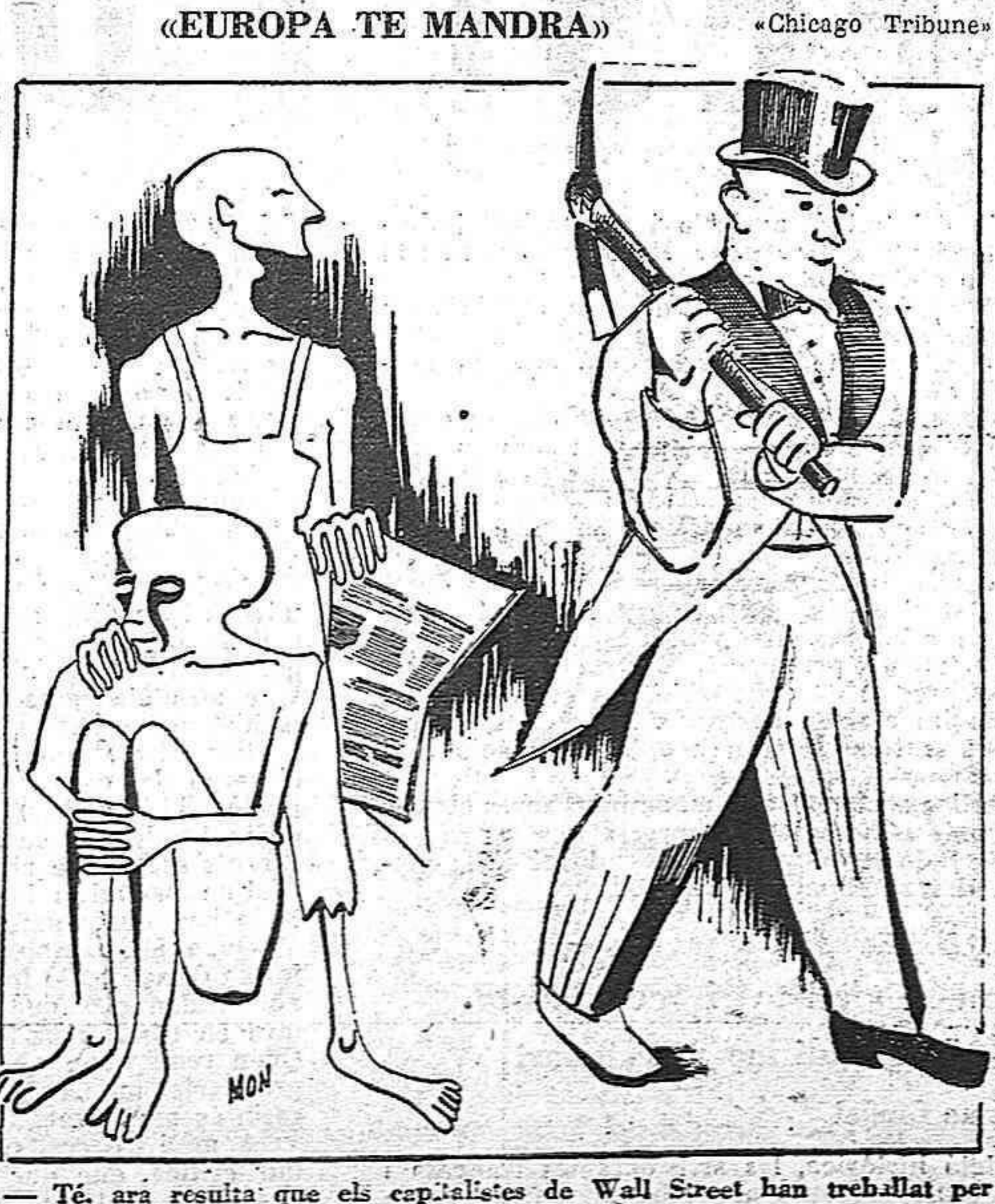
— Té, ara resulta que els capitalistes de Wall Street han treballat per nosaltres!

(El segle XX no és el segle del dòlar sinó el del comunisme) -diu la "Pravda" El centenari del Manifest del Partit Comunista ha estat brillantment celebrat a la U.R.S.S. En un article aparegut a la "Pravda", després de l'afirmació dels NOMES ELS DEIXEBLES FIDELS DE LENIN I STALIN PODEN ESSER QUALIFICATS DE MARXISTES, diu: "La burgesia no va poder anihilar el comunisme al seu naixement. I encara més impossible destruir-lo avui. El segle XX no és el segle del dòlar, com pretenen els imperialistes, sinó que és el segle del comunisme. "Les forces del camp del socialisme i de la democràcia són més potents que les del camp imperialista. Els comunistes de tots els països saben que el partit primordial per a la classe obrera revolucionària és la subestimació de les seves pròpies forces i la sobrestimació de les de l'imperialisme. "Els últims anys, l'avantguarda comunista de la classe obrera no era més que un petit grup d'hommes. Avui, els partits comunistes de tot el món tenen un exèrcit que aplega milions d'hommes, poderós per la seva unitat i el seu potencial i el seu orgull i la seva fidelitat a les masses revolucionàries i al marxisme-leninisme. "Els últims esdeveniments de Txecoslovàquia demostraran que la classe obrera constituïx un factor decisiu en la defensa dels règims democràtics i populars contra qualsevol atac de la reacció interior i exterior. Aquest mes serà posat en venda un fulllet contenint la traducció catalana del Manifest del Partit Comunista