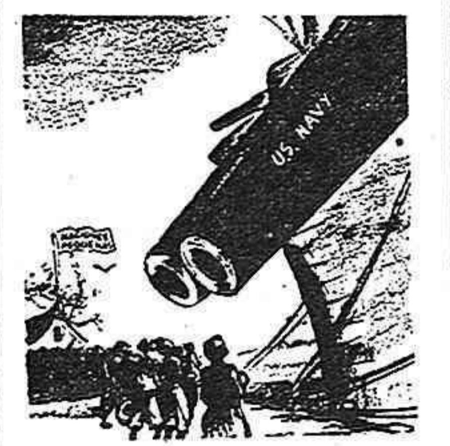
VISITAS DE "BUENA VOLUNTAD"