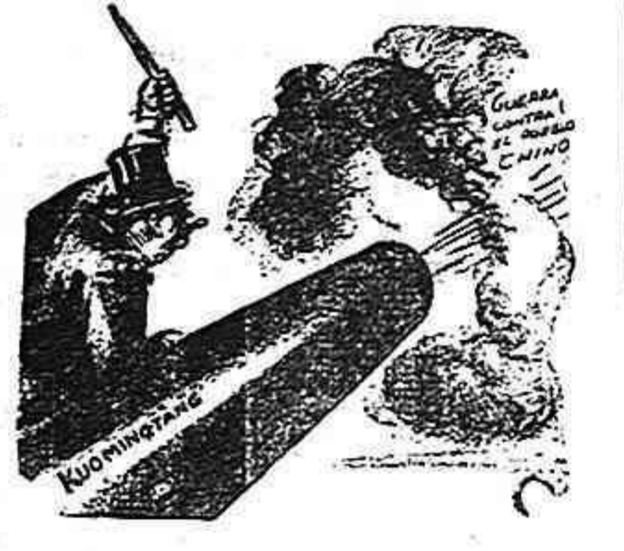
BAJO LA BATUTA DE WALL STREET

Los astilleros de Moscú celebran estos días el XV aniversario de su fundación. Desde esa fecha han construido 1,700 barcos de todas clases. Actualmente los astilleros se están ampliando.