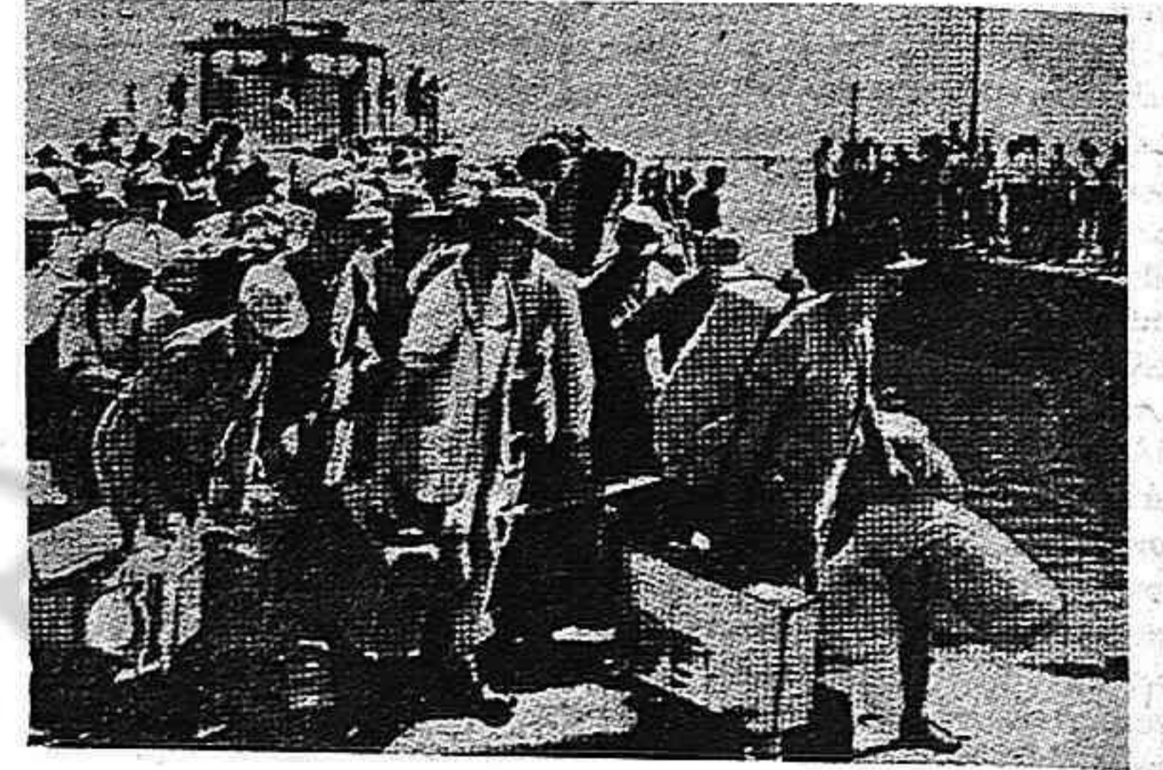
Si, todavía los nazis construyen campos de concentración. Es difícil de creer, pero aquí está la prueba. La foto muestra un nutrido grupo de criminales nazis desembarcando en Chipre, llevados por un buque de guerra británico, para construir "barracas" destinadas a los judíos capturados en Palestina. La espantosa odisea del pueblo judío bajo el hitlerismo prosigue de esta increíble forma bajo el trato brutal del imperialismo británico.