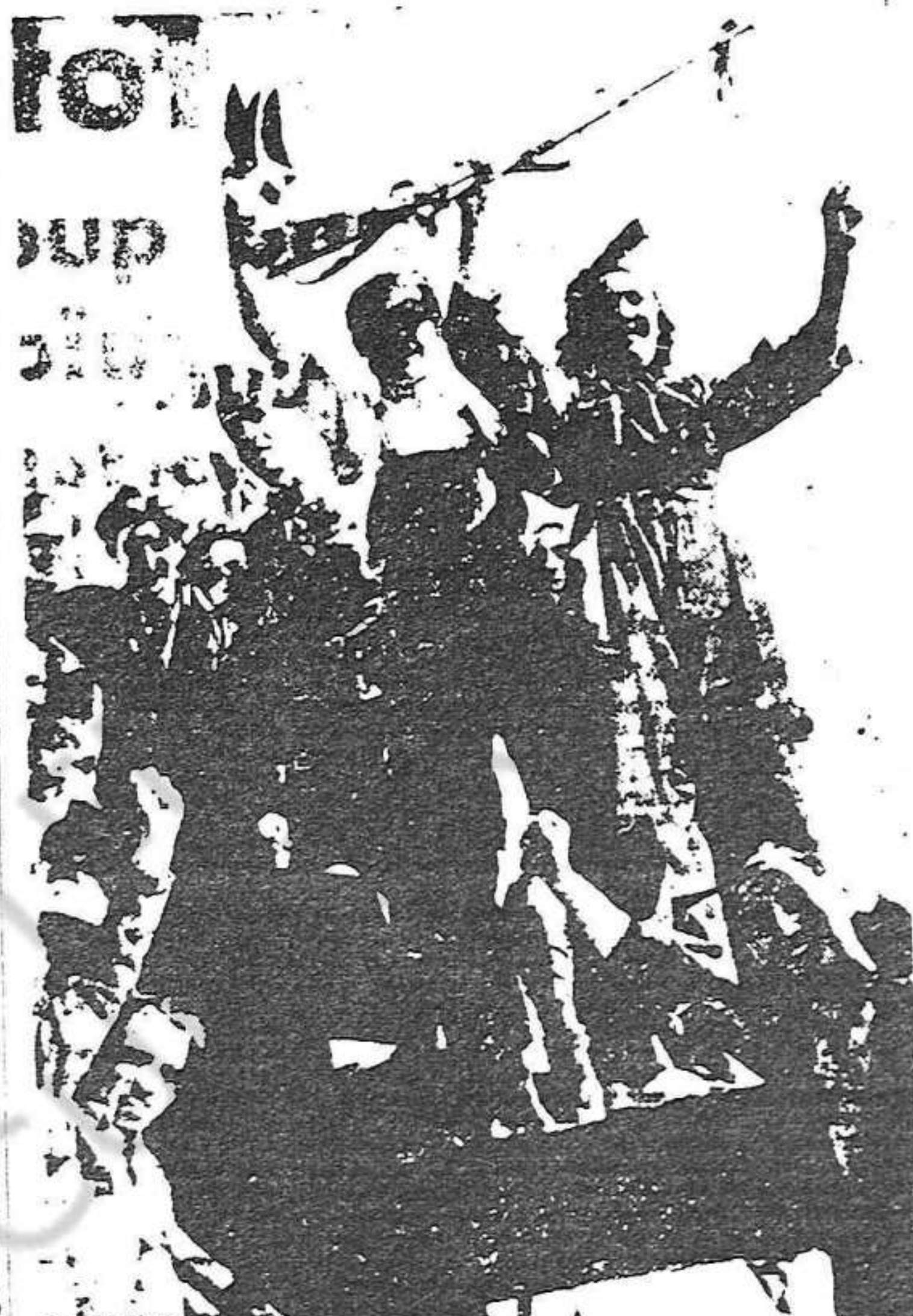
Els milicians que combaten a l'Alto del Leon

Tots els ferits assistits a Barcelona, Llívia, Manresa, Casp, etc., segueixen millorant de llurs ferides i en vies de franca guarició.