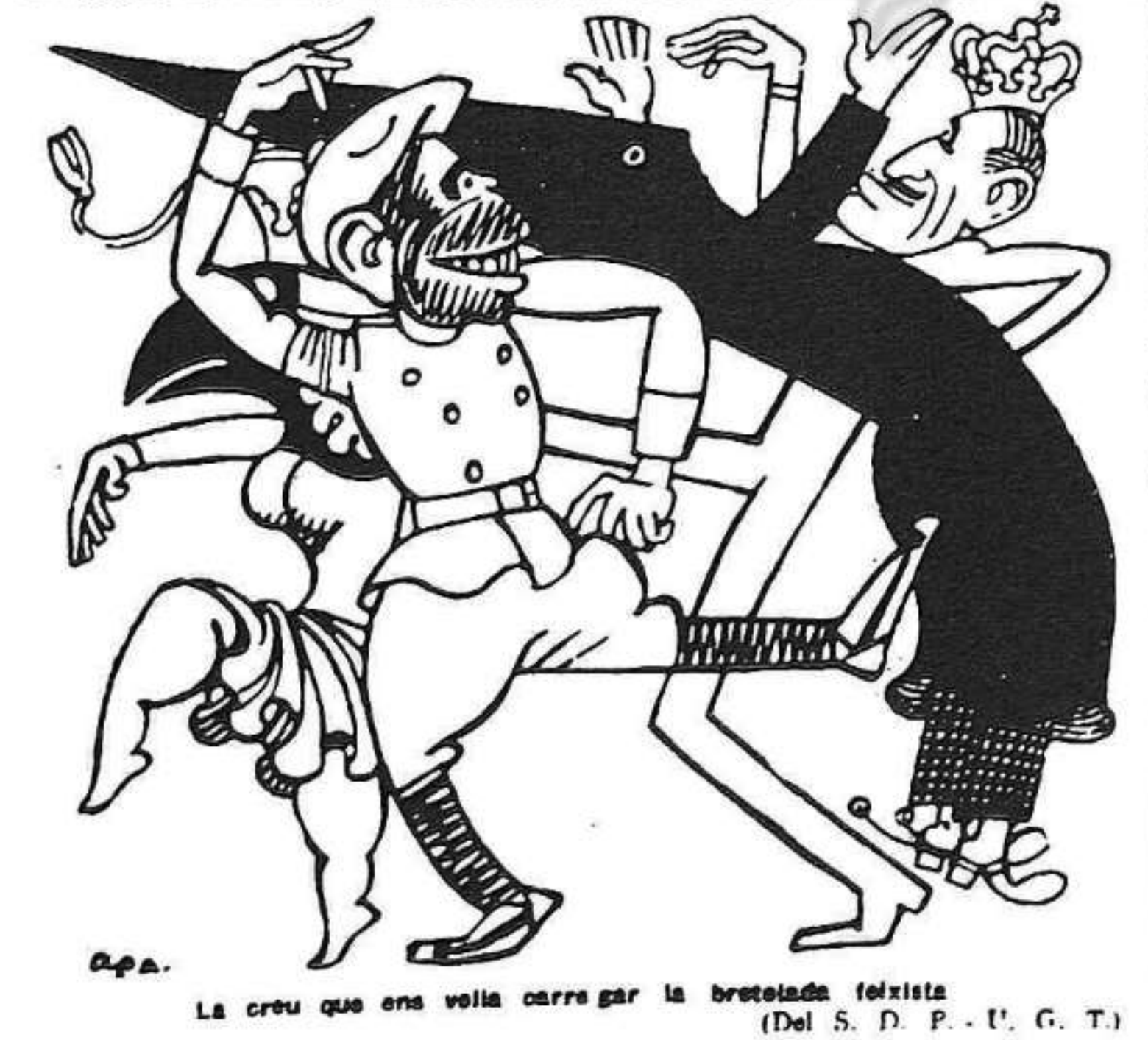
La creu que ens volem carregar la bretolada feixista (Del S. D. P. - U. G. T.)