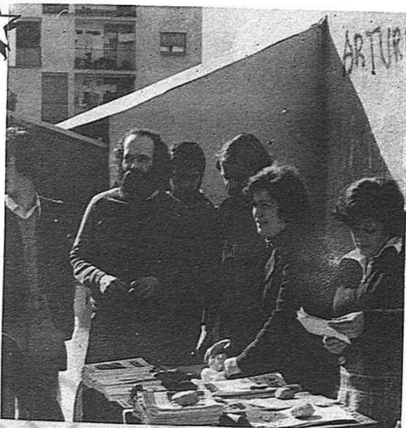
Venda de TREBALL a Terrassa

● Reforçar la capacitat del partit de donar alternatives a tots els nivells de la societat i concretar-les en propostes institucionals, com ja s'apunta en el document de política municipal. No es tracta de diferenciar-se només per una ideologia, sinó per la qualitat de ser el portaveu de les aspiracions populars i d'inspirar confiança respecte a la nostra capacitat per realitzar les nostres propostes.