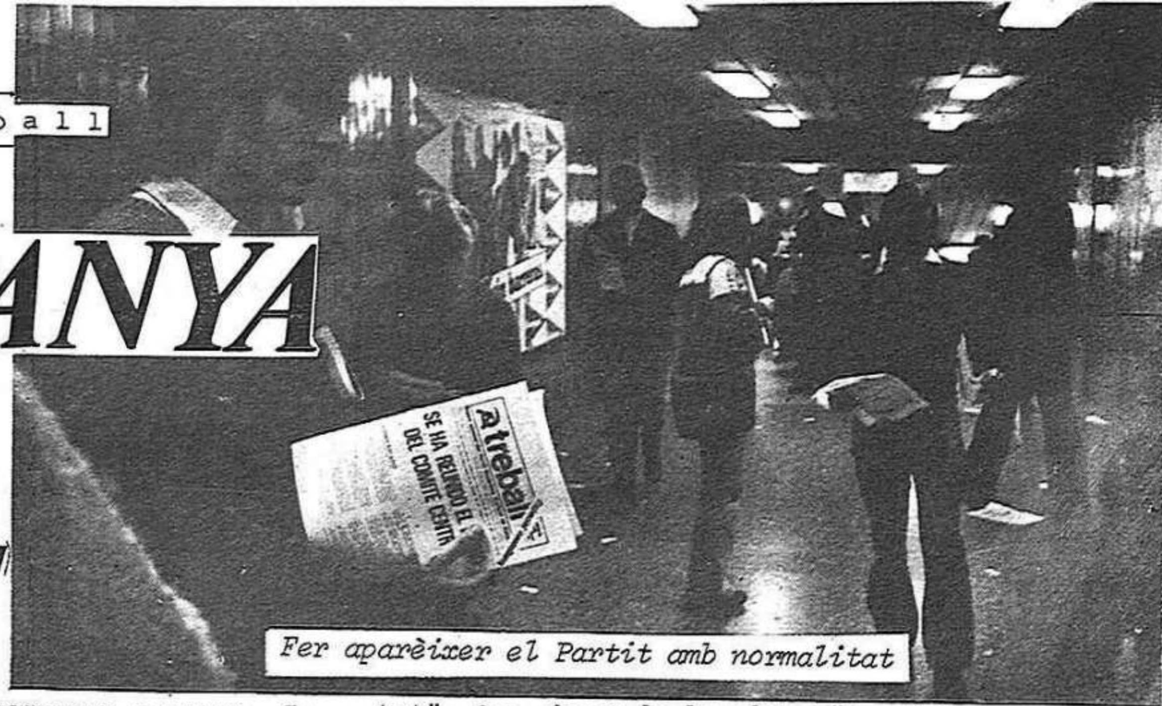
Fer aparèixer el Partit amb normalitat

La decisió del PSUC de participar decididament a les properes eleccions planteja a totes les organitzacions del Partit, a tots els militants, una colla de qüestions concretes, el tractament de les quals és imprescindible per poder afrontar amb èxit el repte electoral.