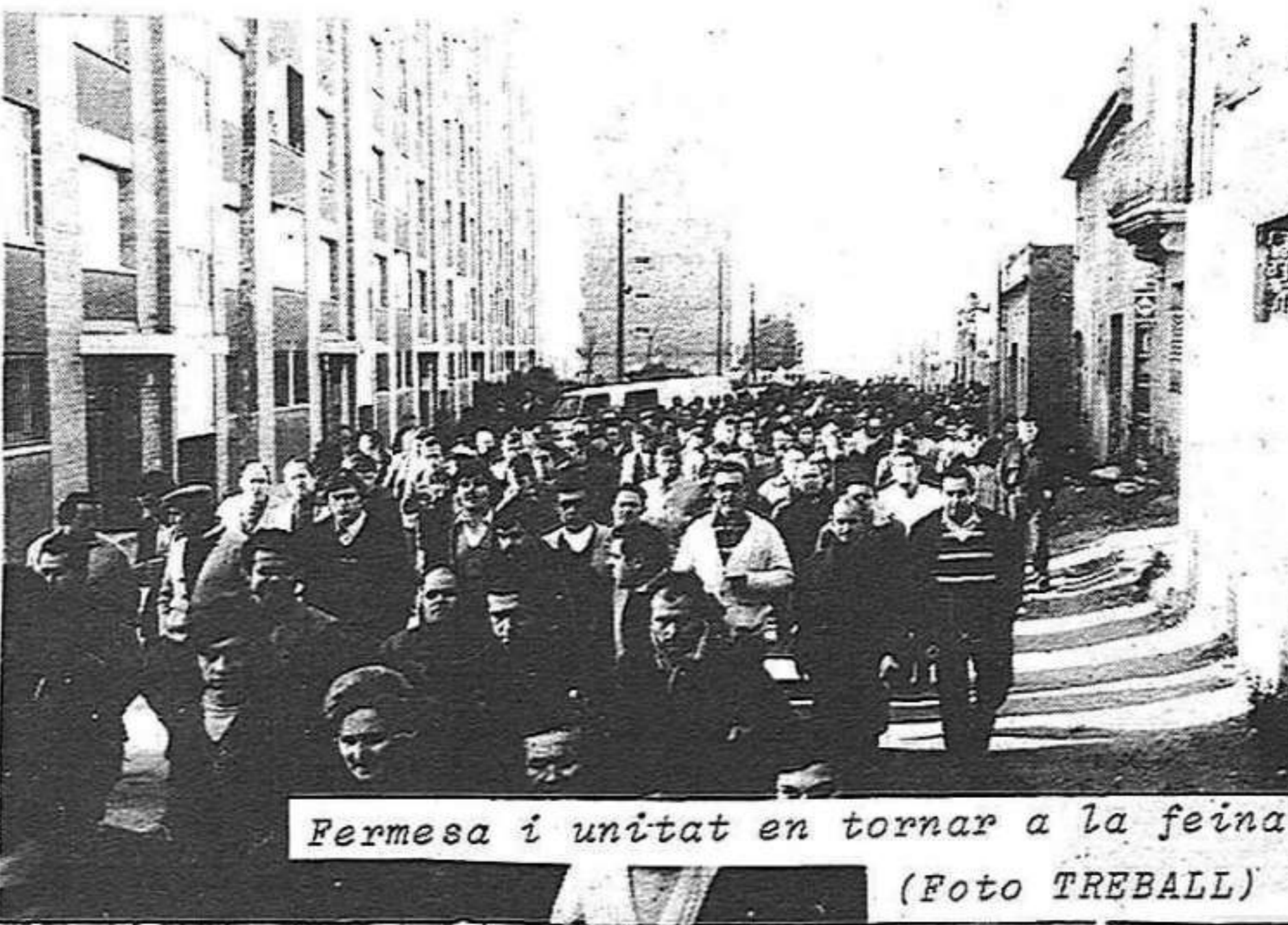
Fermesa i unitat en tornar a la feina