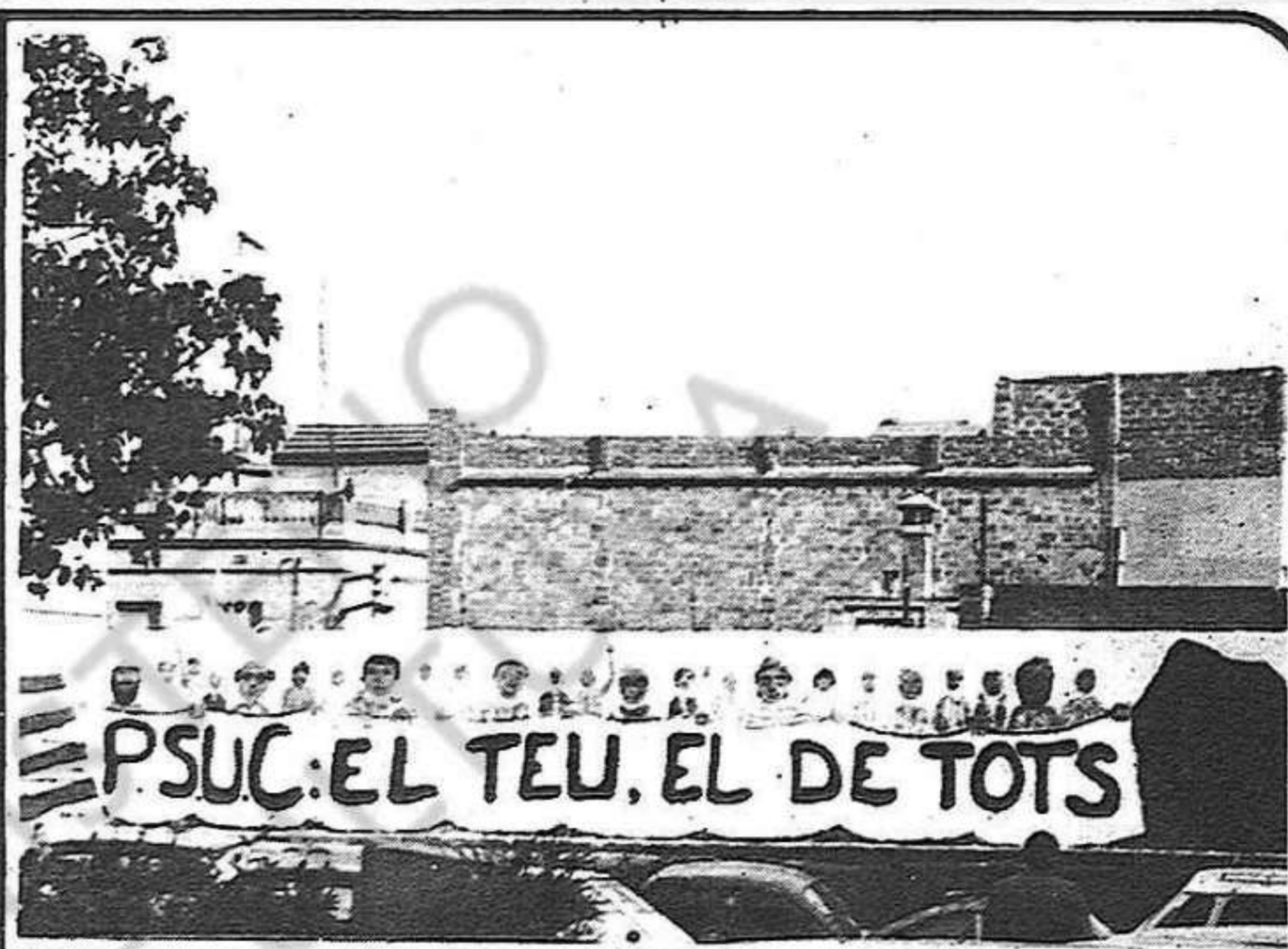
Pintada a La Sagrera