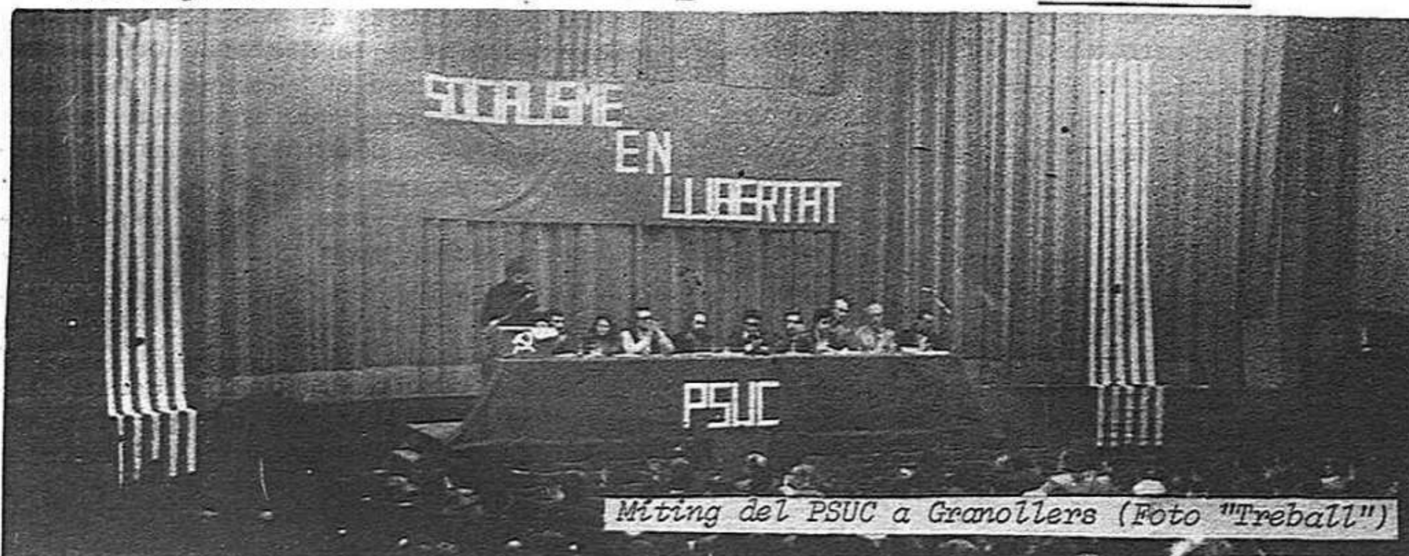
Míting del PSUC a Granollers

La transformació de la cèl.lula en agrupació està estretament lligada a una política de reclutament conseqüent i planificada a cada comitè, que permeti l'entrada constant d'homes, dones i joves al Partit. Cal que els comitès entenguin que l'agrupació ha de ser un organisme que s'insereixi en tots els sectors de la societat d'allà on actua.