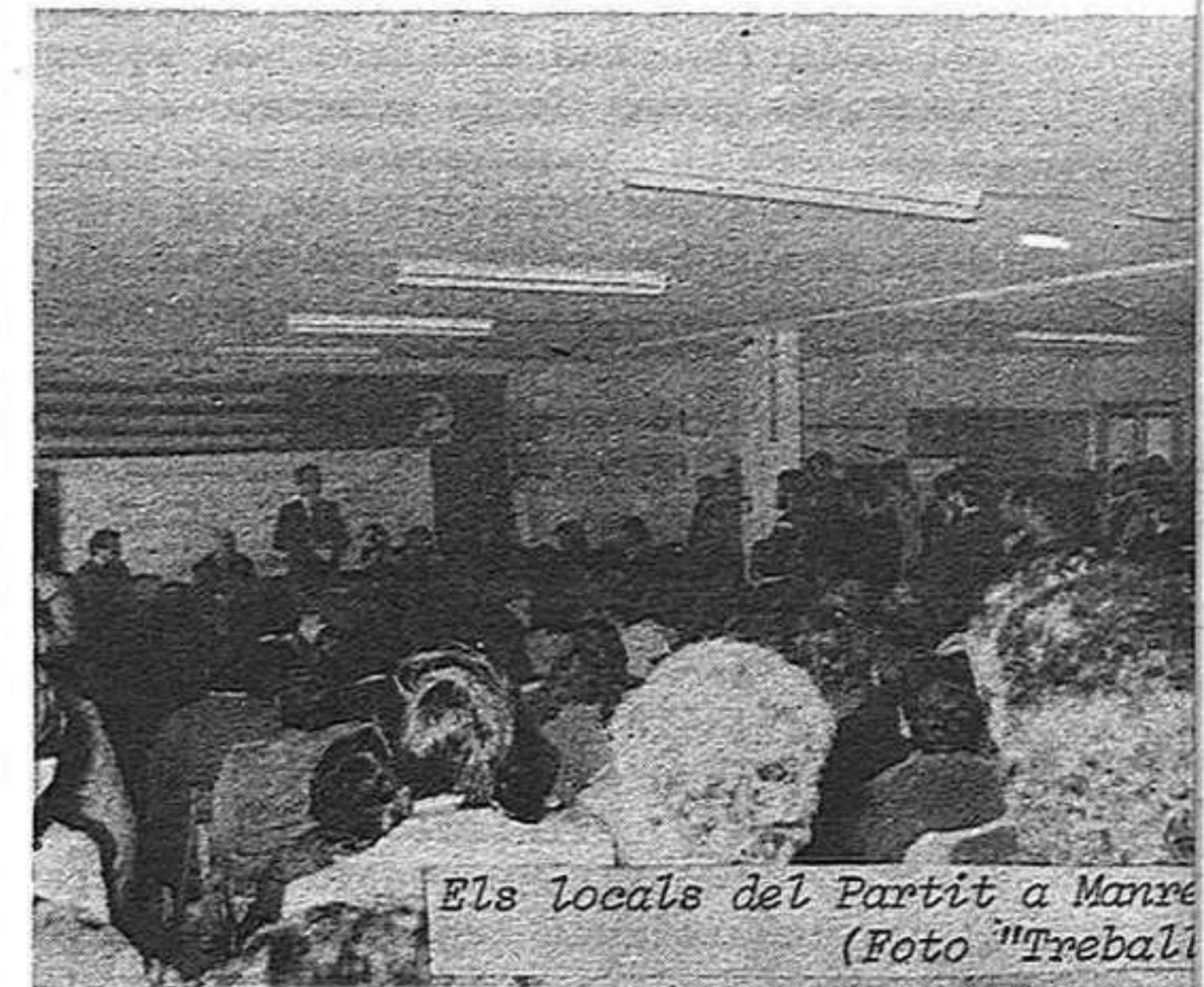
Els locals del Partit a Manresa

curt, l'objectiu dels 50.000 afiliats que va plantejar el company Gregori López Raimundo al ple del Comitè Central del nostre partit del setembre de 1976 i que és, ensems, una de les fites essencials de la immediata campanya electoral.