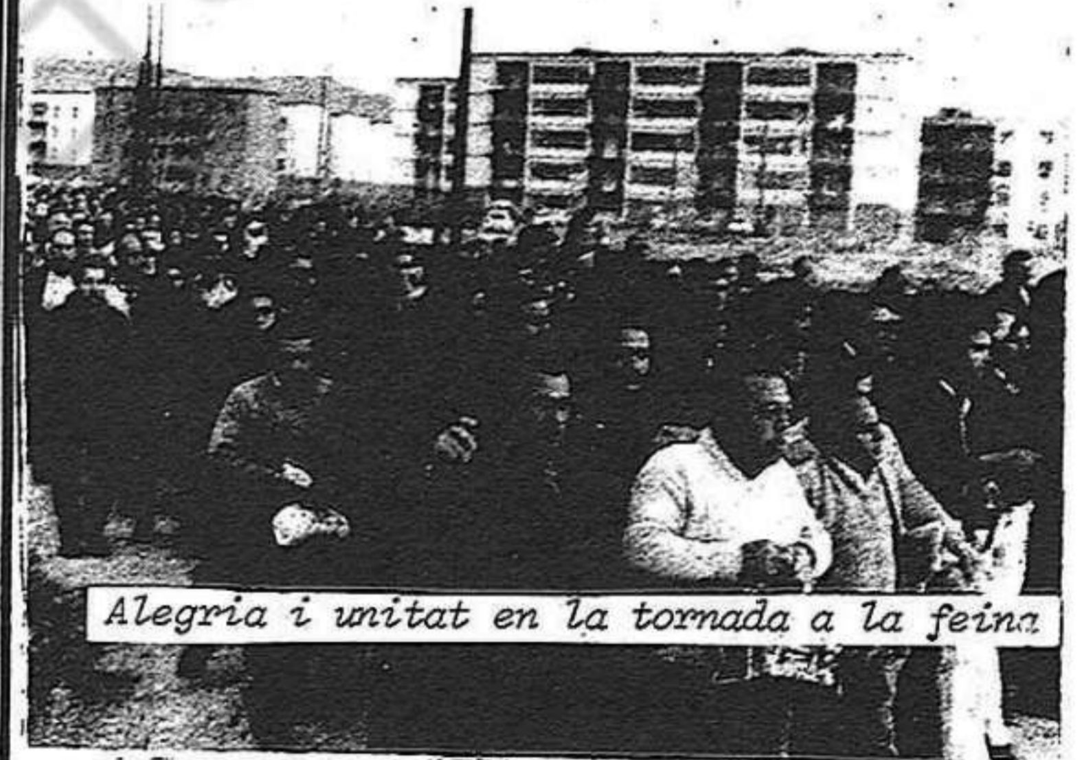
Alegria i unitat en la tornada a la feina

La lliçó, en primer lloc, d'unes condicions de treball inhumanes, que hem de seguir denunciant i contra les quals se seguiran lluitant els treballadors de Roca.