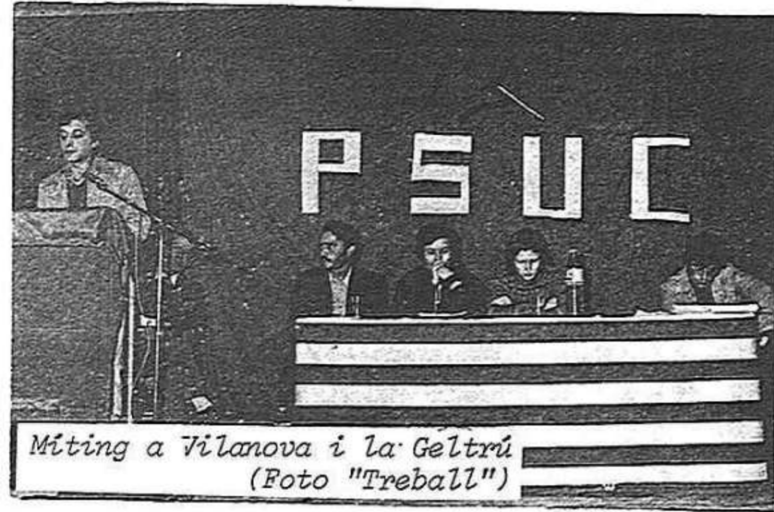
Miting a Vilanova i la Geltrú

En aquest sentit, encara no hem assolit a Catalunya el tipus d'agrupació de tres-cents i quatre-cents afiliats, que estigui organitzada sobre la base de l'existència de grups de quaranta o cinquanta membres, amb les respectives direccions, que no cal que siguin massa grans, tal com va plantejar-se a la reunió de Roma.