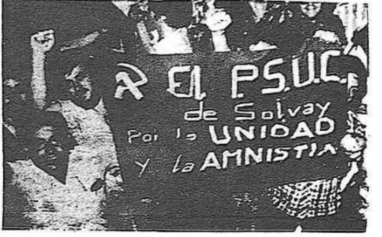
Portada del número extraordinari de "Treball" dedicat a la Setmana del Partit a Barcelona, del qual se n'han editat 100.000 exemplars

A Tarragona també comença avui la Setmana del Partit, de característiques semblants a la de Barcelona. Entre els dos actes centrals -miting i festa de cloenda- hi haurà venda pública de la premsa, presentacions dels col·lectius del Partit, etc. Tot això en la perspectiva de la celebració de la Conferència del Partit.