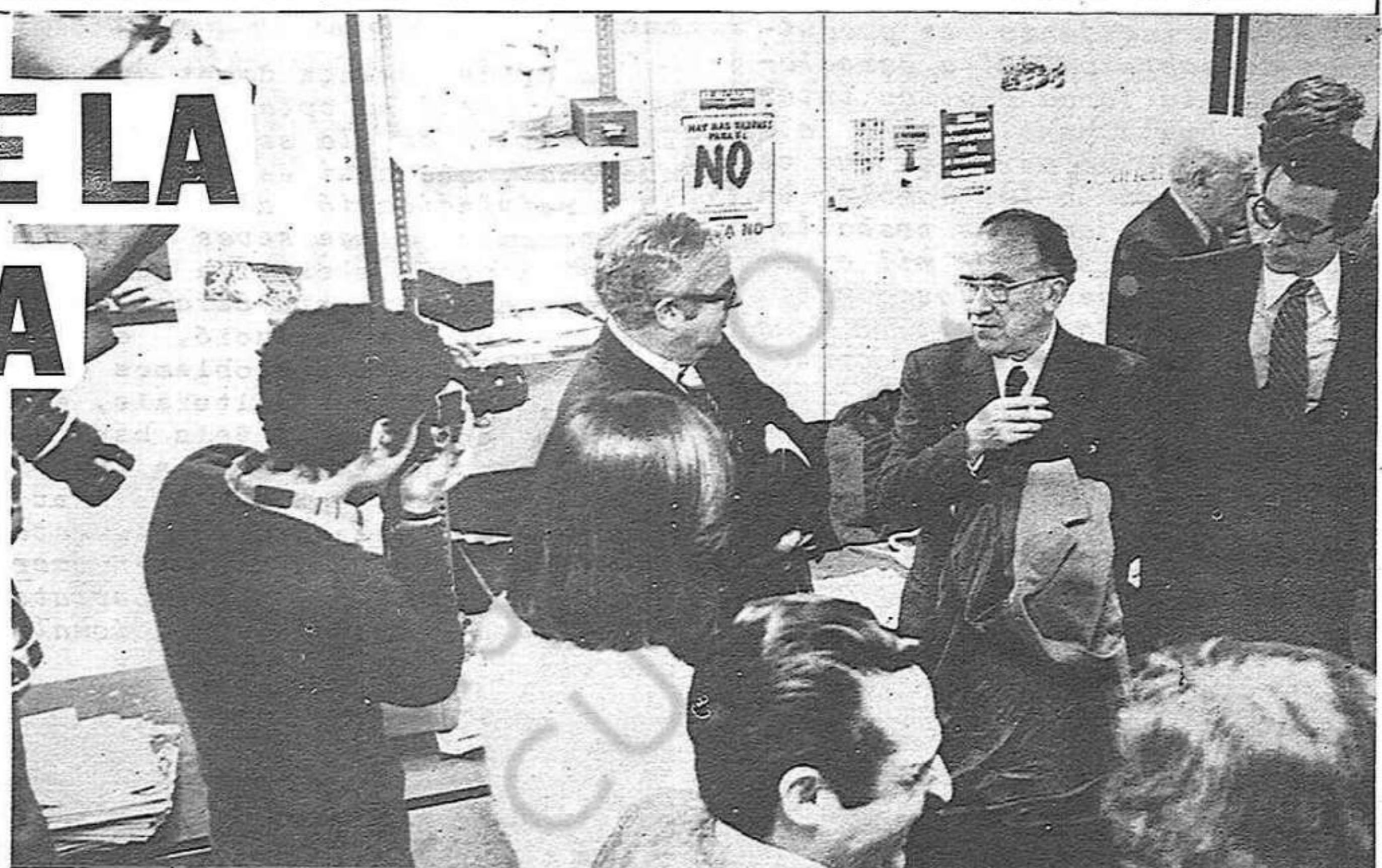
Santiago Carrillo, a la redacció de la revista "Mundo"

La legalització dels partits i sindicats sense discriminació de cap mena és una premissa i una exigència del procés de democratització del nostre país.