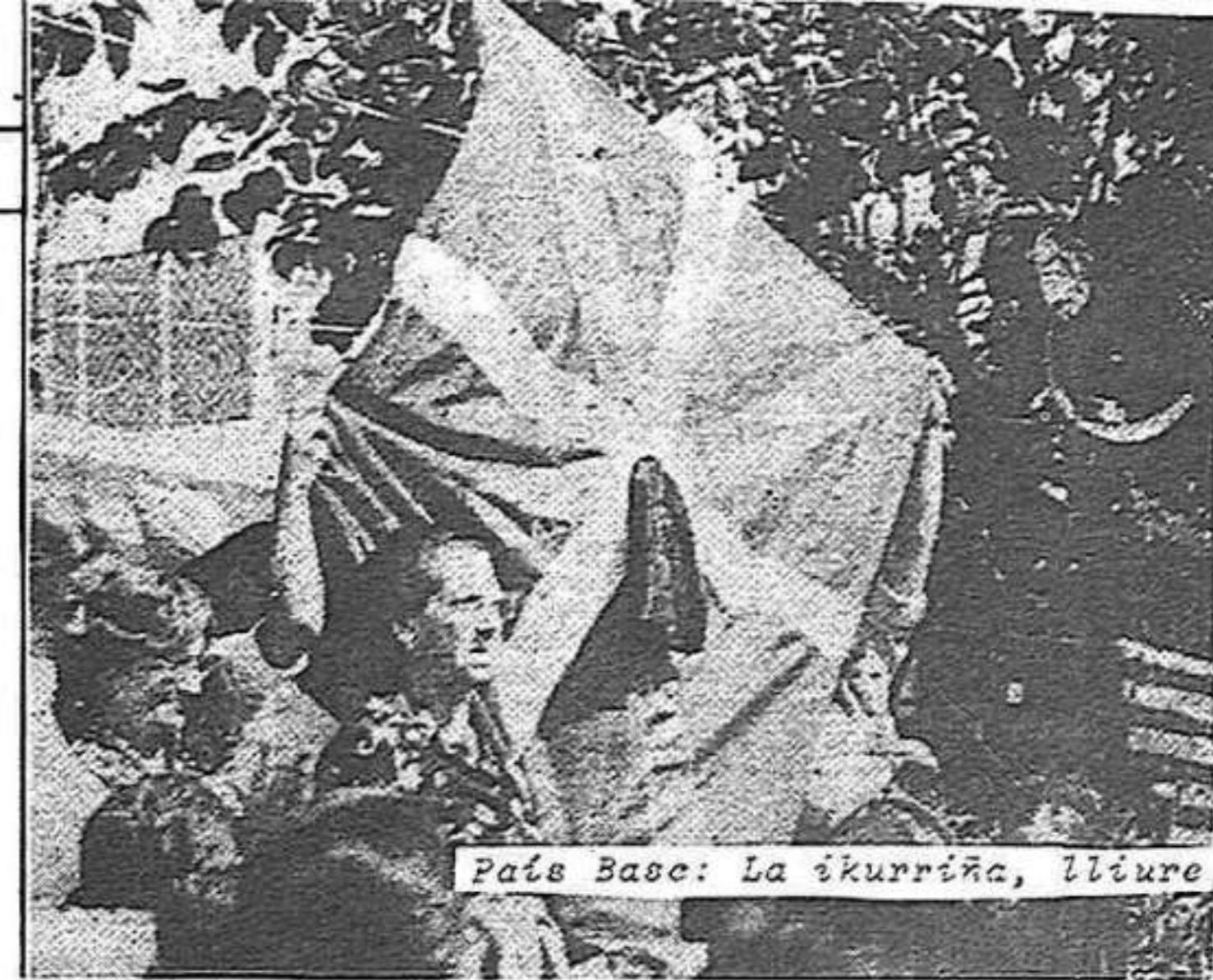
País Basc: La ikurriña, lliure

Però a la darrera assemblea de la Reunió s'aprovà un text que, per alguns dels seus elements, s'allunyava del procés seguit i que poc servia per a la finalitat esmentada. El text aprovat és una afirmació testimonial, subscribible per tots els demòcrates, però que té poc a veure amb la política actual. Es va voler radicalitzar les formulacions, però el que s'aconseguí fou diluir-ne el contingut. O sigui que, en carregar el text amb tots els possibles greuges actuals a la nostra so-