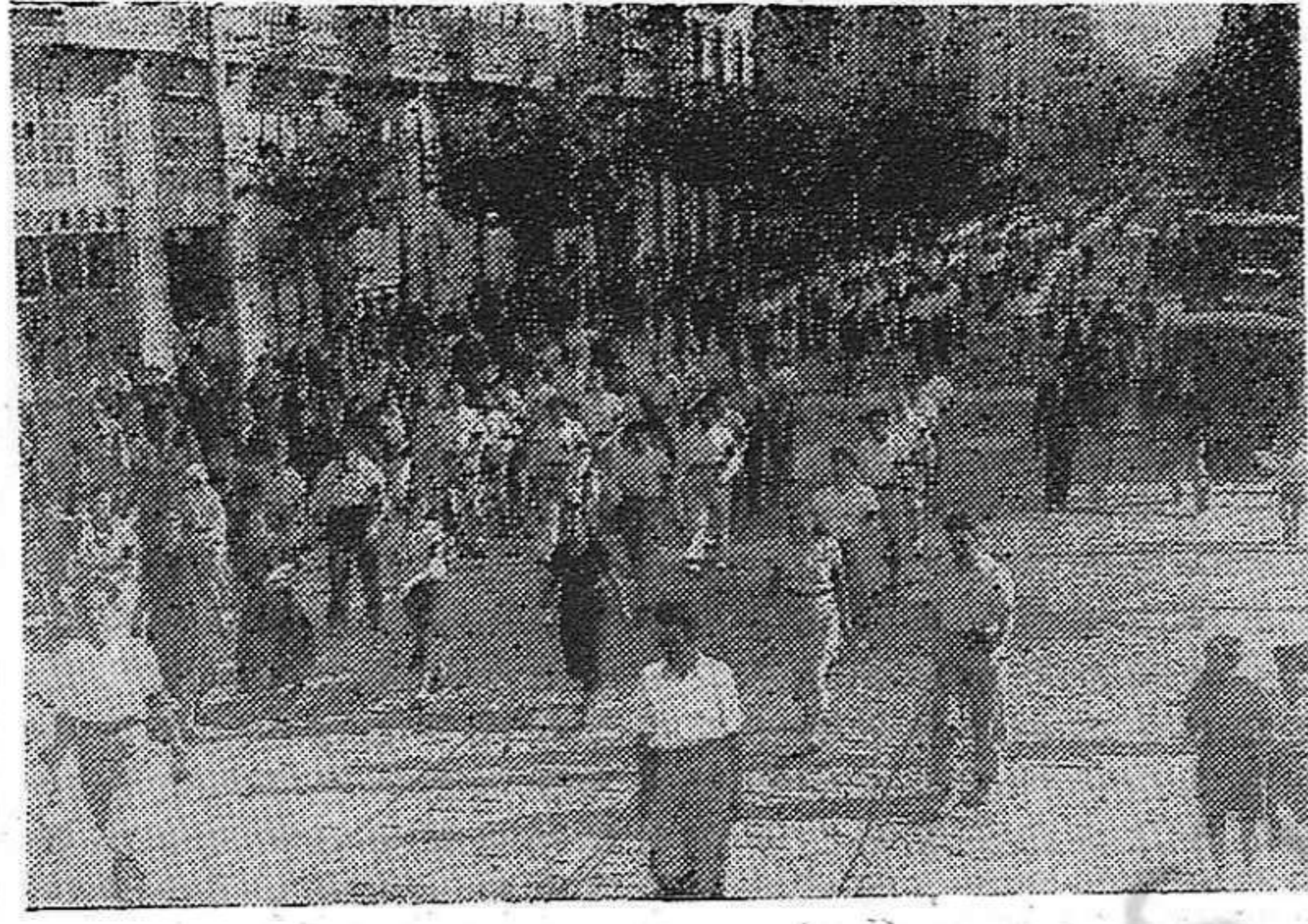
En los días más duros de la defensa de Bilbao contra los ataques franquistas, el proletariado de Bilbao en armas, el 1º de Mayo de 1937, se manifestaba en las calles de la capital demostrando su entusiasmo y su voluntad inquebrantable en la lucha por la libertad y la República.

« Nosotros en ningún caso nos prestaremos, ni por acción ni por omisión, a manejos ni tratos que pongan en peligro las Instituciones republicanas y el derecho de la República ».