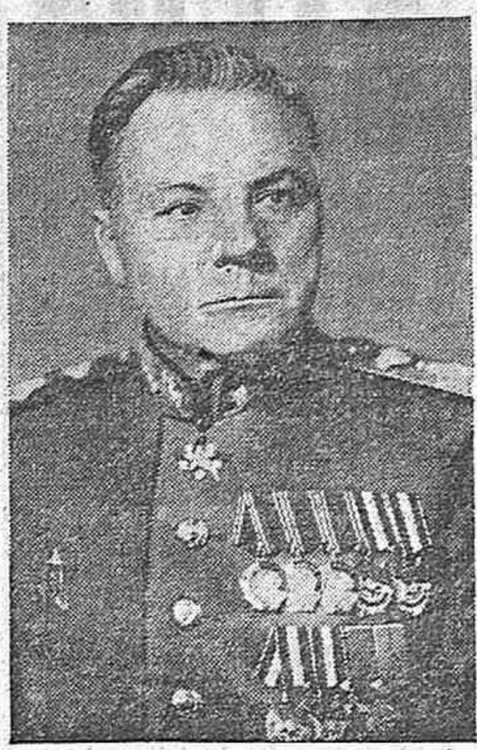
El mariscal Klim Vorochilov ha sido nombrado vicepresidente del Consejo de ministros de la Unión Soviética.