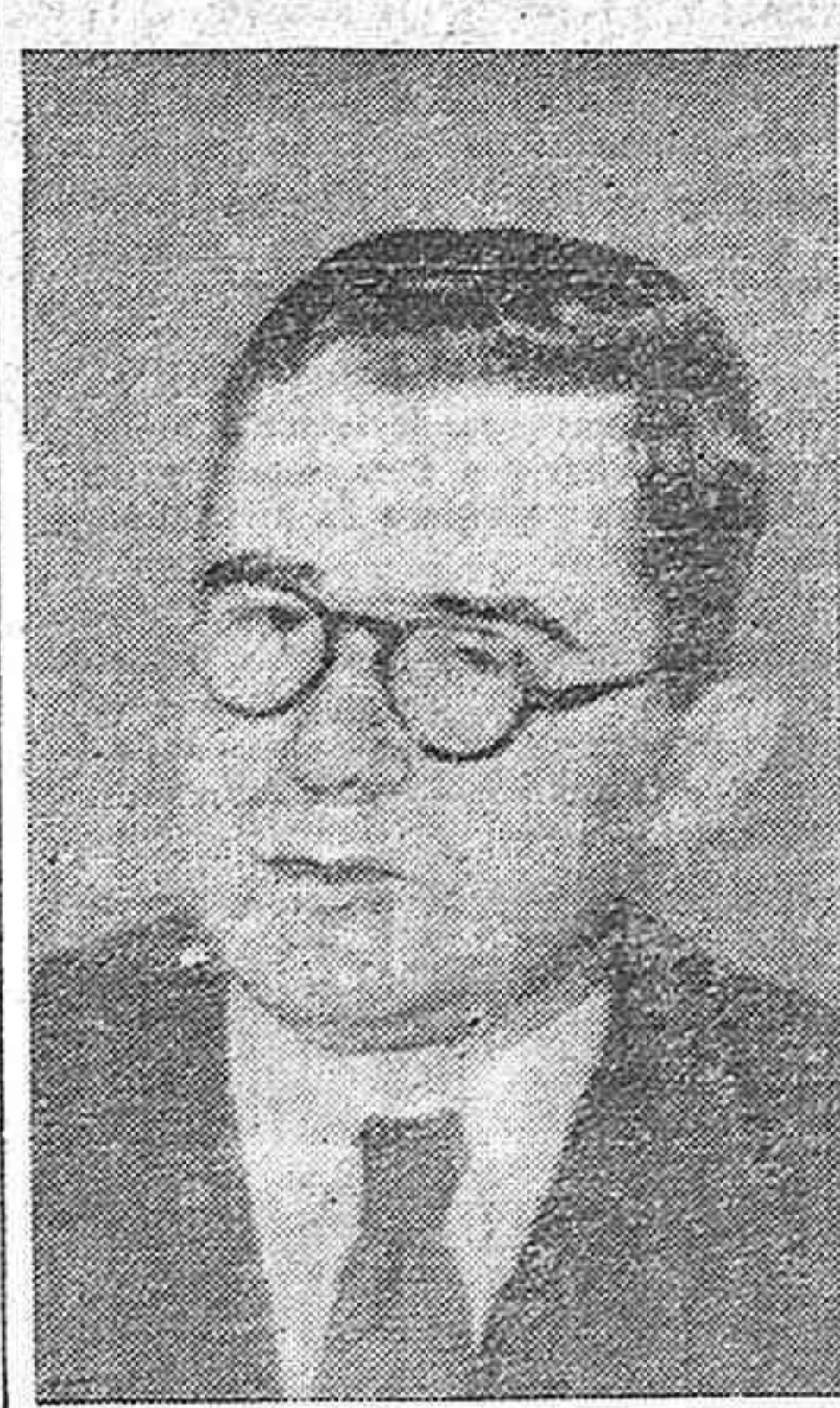
Andrei Gromyko, delegado permanente de la U.R.S.S. en el Consejo de Seguridad de la O.N.U., desde cuyo puesto ha prestado tan señalados servicios a la República española...