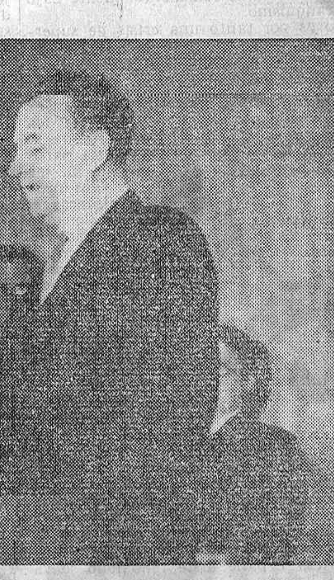
Clement Gottwald en el acto de la toma de posesión.

Este es a grandes rasgos el programa que el nuevo gobierno checoslovaco llevará a la práctica, bajo la suprema dirección de Clement Gottwald, el Presidente Unificado, como ha comenzado a llamarlo el pueblo.