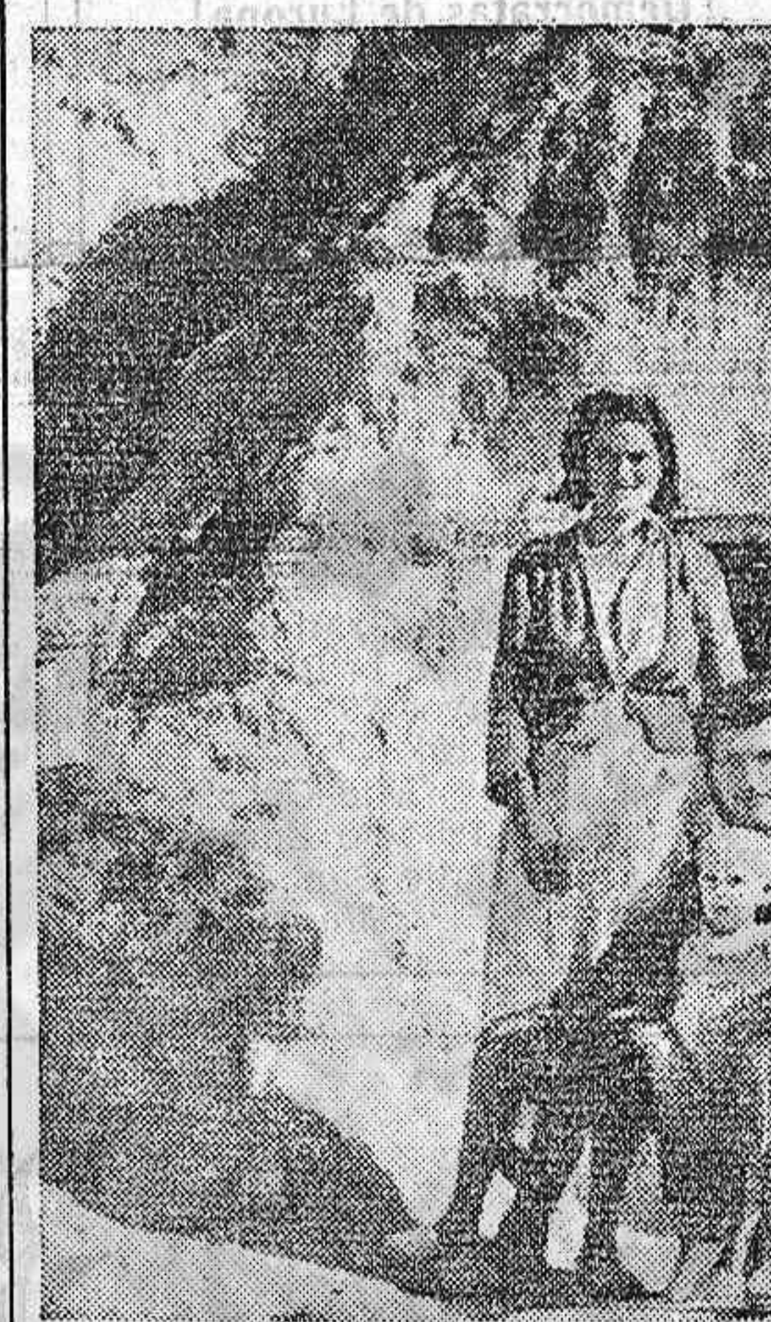
Un reportero norteamericano ha conseguido hacer en Madrid esta impresionante foto. Es una joven familia obrera ante la «morada» que se han tenido que cavar ellos mismos en la tierra.