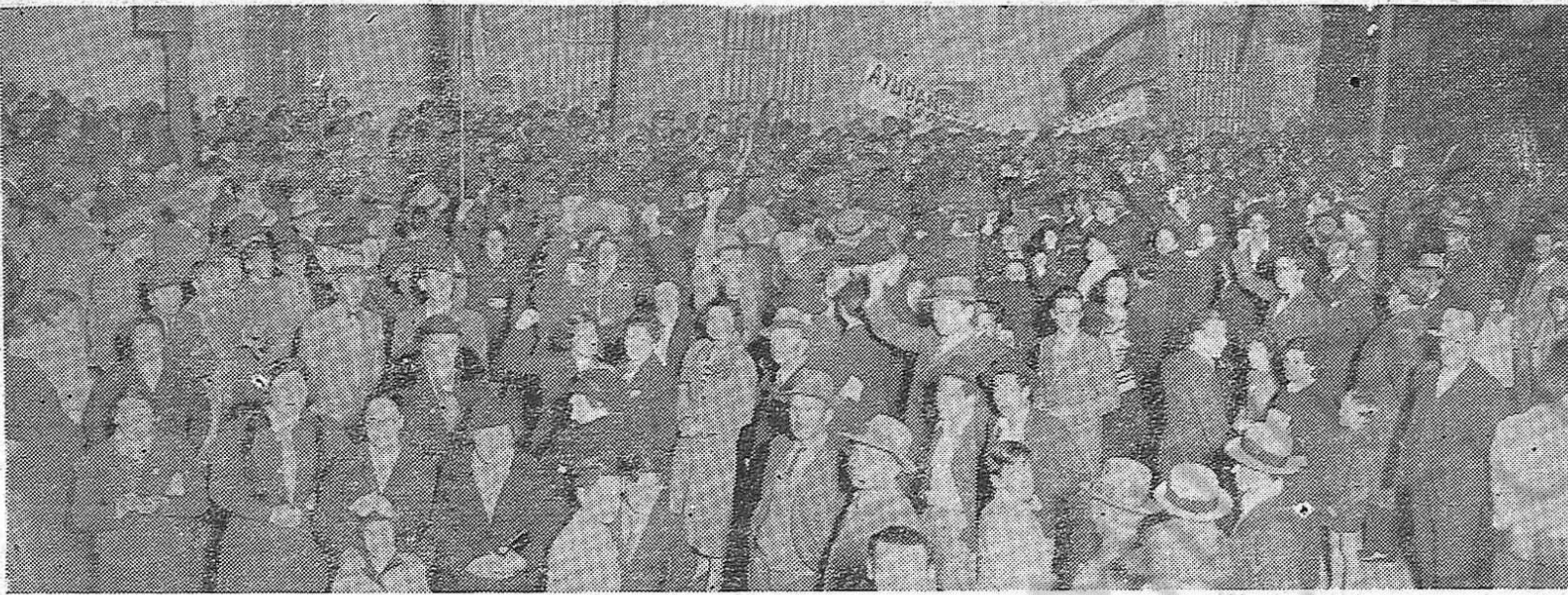
VISTA GENERAL del público asistente al gran acto de la plaza leta del Palacio Legislativo, organizado por los Comités 50. Regimiento, Aguada y General Miaja. — Este acto obtuvo un resonante éxito y el más franco apoyo de los vecinos de la barriada.