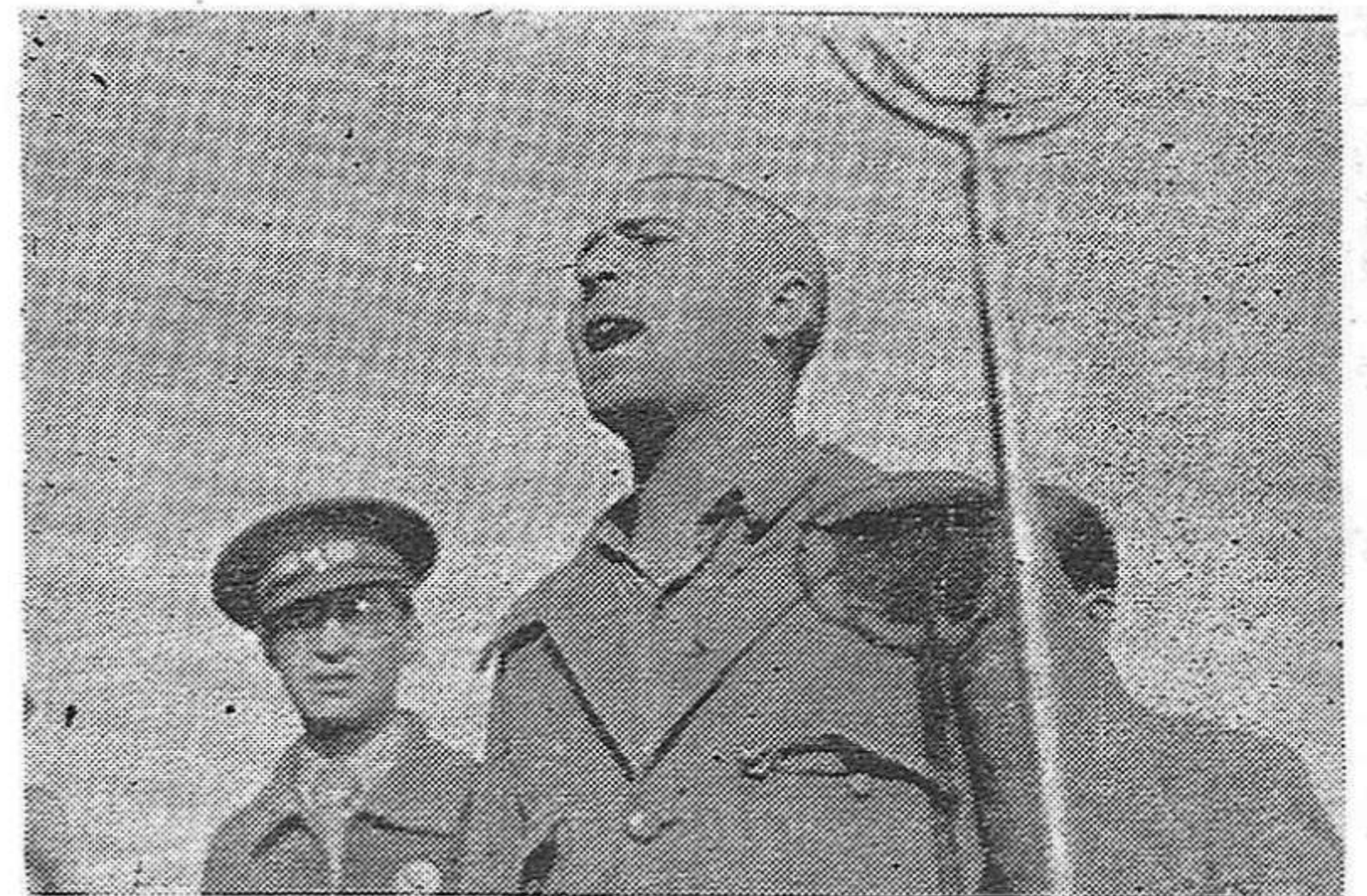
LA GUERRA lo sorprendió cursando sus estudios de medicina en la Facultad de una provincia en poder de los facciosos. — Lo obligaron a luchar en filas de Franco. — Ahora está prisionero en campo republicano y grita bien alto, para que todos sepan los horrores que soportó

des que constituya la garantía plena para los donantes, de que esta se lleva a cabo de un modo totalmente correcto y eficaz... — Como quiera que el movimiento de ayuda a España en el extranjero se lleva a cabo por