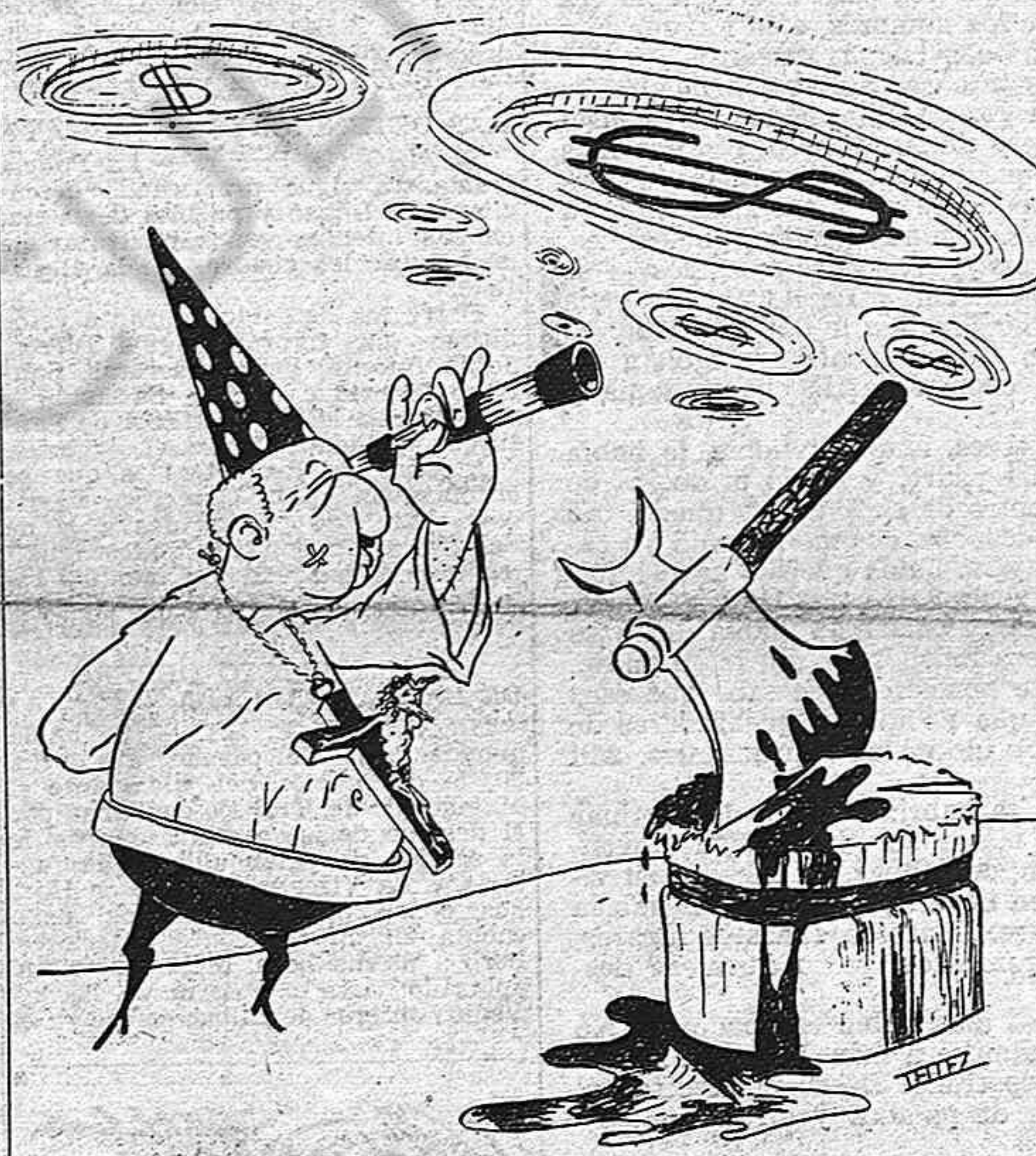
Las misteriosas plataformas volantes que tanta emoción causaron en diversos países europeos, han hecho su aparición en el cielo de España. Los españoles han podido identificar estos objetos de una manera precisa. Parece ser que la divulgación de este descubrimiento dejará pasmados a los sabios del mundo. (Comunicado.)