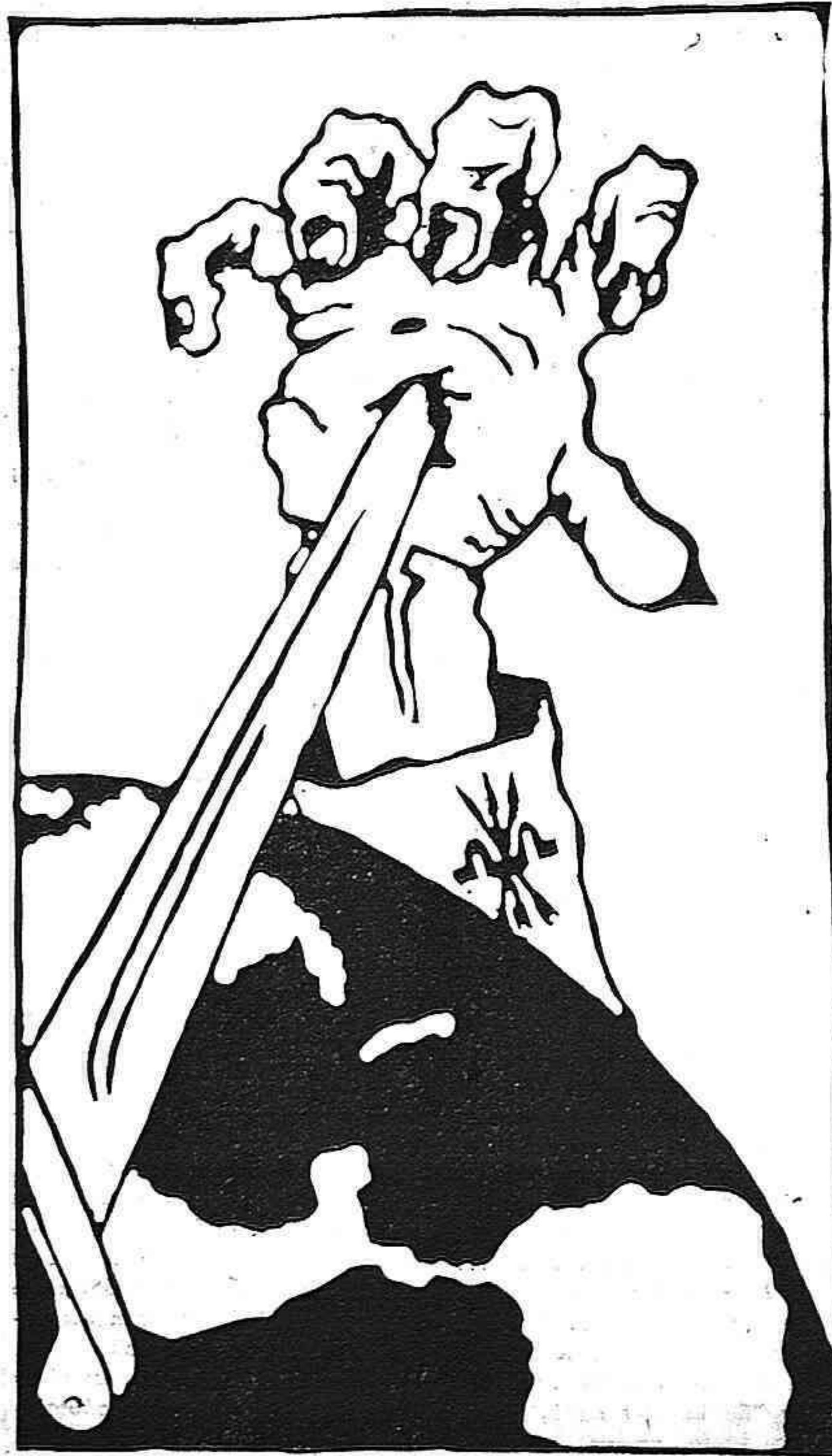
En 3a. Pag: DESCARADO TRABAJO DE LA FALANGE EN MEXICO