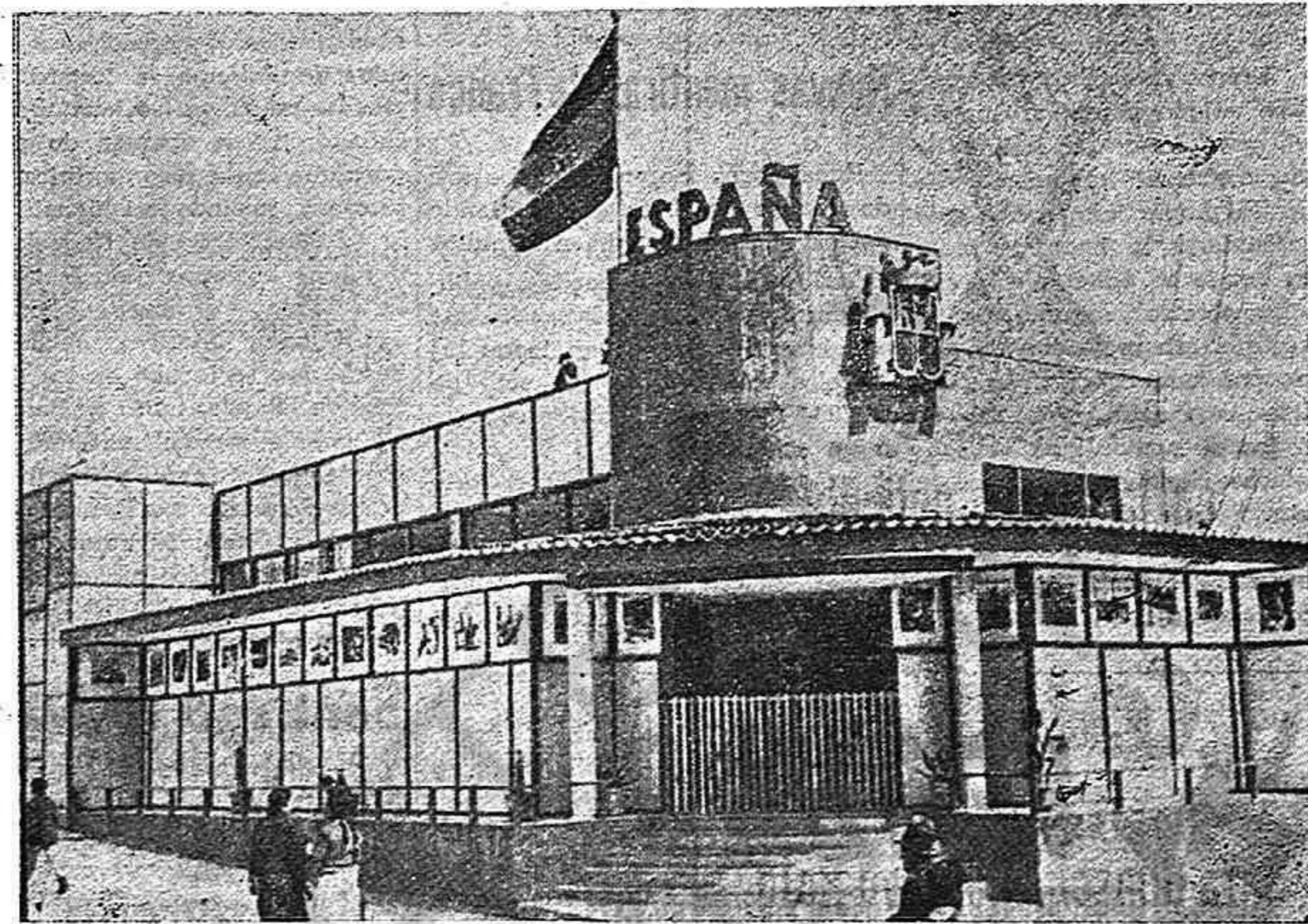
En la Feria del Libro de México.—Aspecto exterior del hermoso pabellón de la República Española montado en la Feria por los servicios de propaganda del Gobierno de la República. Millares y millares de mexicanos han visitado ya la instalación en cuyo alto flamea la bandera republicana española.