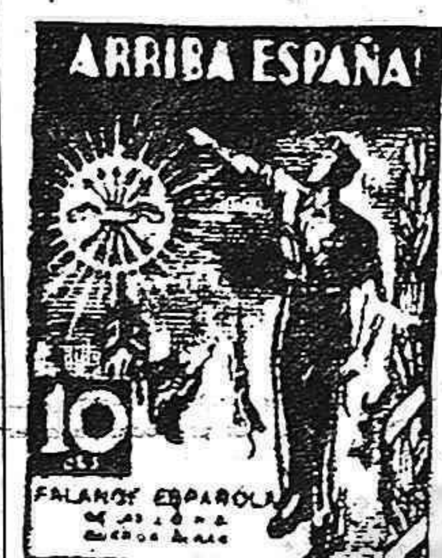
Facsimil de una estampilla impresa y puesta en venta por Falange en la Argentina. Con este y otros procedimientos, Falange, en Argentina y en todos los demás países americanos, recauda fondos y hace propaganda fascista en favor del régimen franquista.