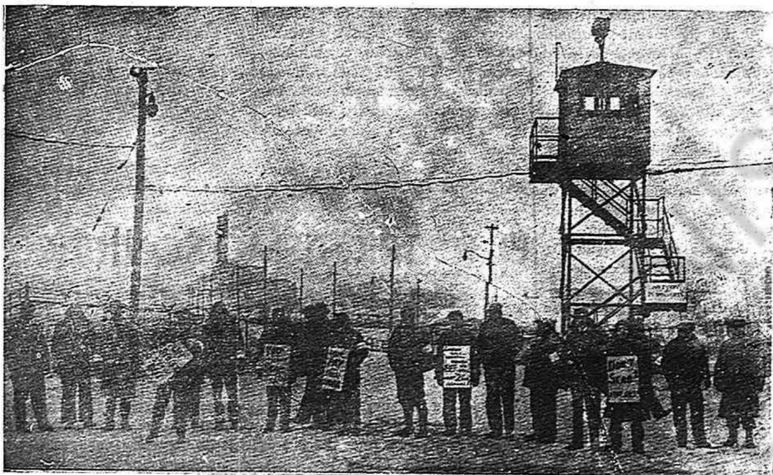
Gigantesca masa de trabajadores norteamericanos luchan en estos momentos por la elevación de salarios y el mejoramiento de sus condiciones de vida. Los grandes trusts y monopolios norteamericanos, no satisfechos aún con los fabulosos beneficios obtenidos durante la guerra, tratan de seguir acumulando mayores ganancias a expensas de los obreros. En la foto puede verse uno de los piquetes de huelguistas frente a la gran fábrica de la General Electric en Schenectady.

Señor Ministro, nosotros le pedimos plantee al Gobierno estas proposiciones que tendrán un eco en la Península, en toda Europa, en América del Sur. Nosotro nos ganaremos así, la amistad indestructible de un pueblo que estará a nuestro lado para defender la causa de la paz y la seguridad de Francia. (Aplausos).