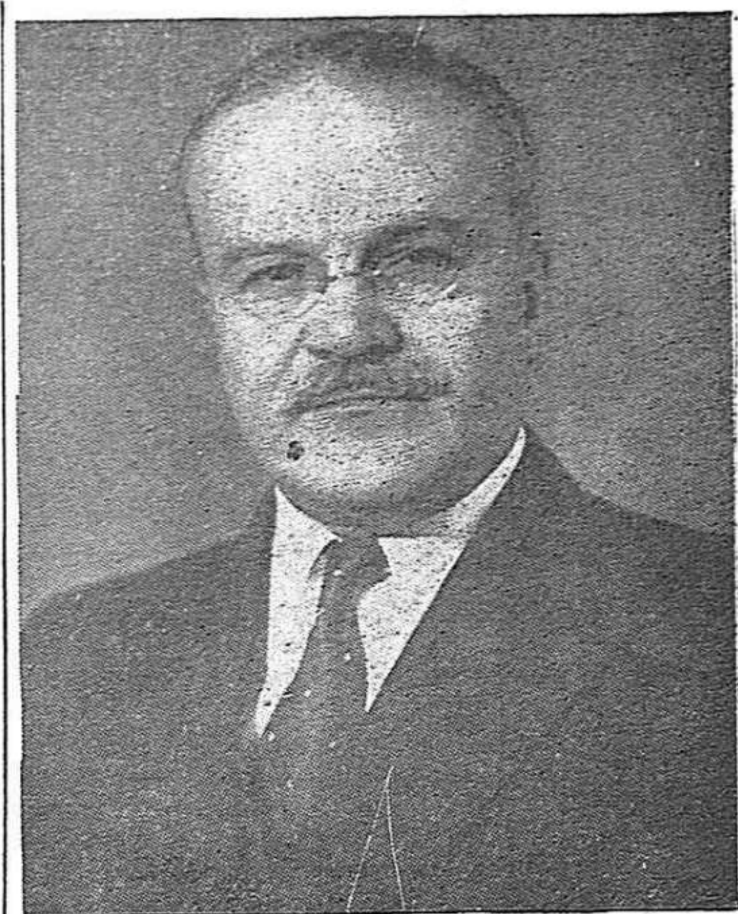
Viacheslav M. Molotov, Ministro de Relaciones Exteriores del Gobierno Soviético.