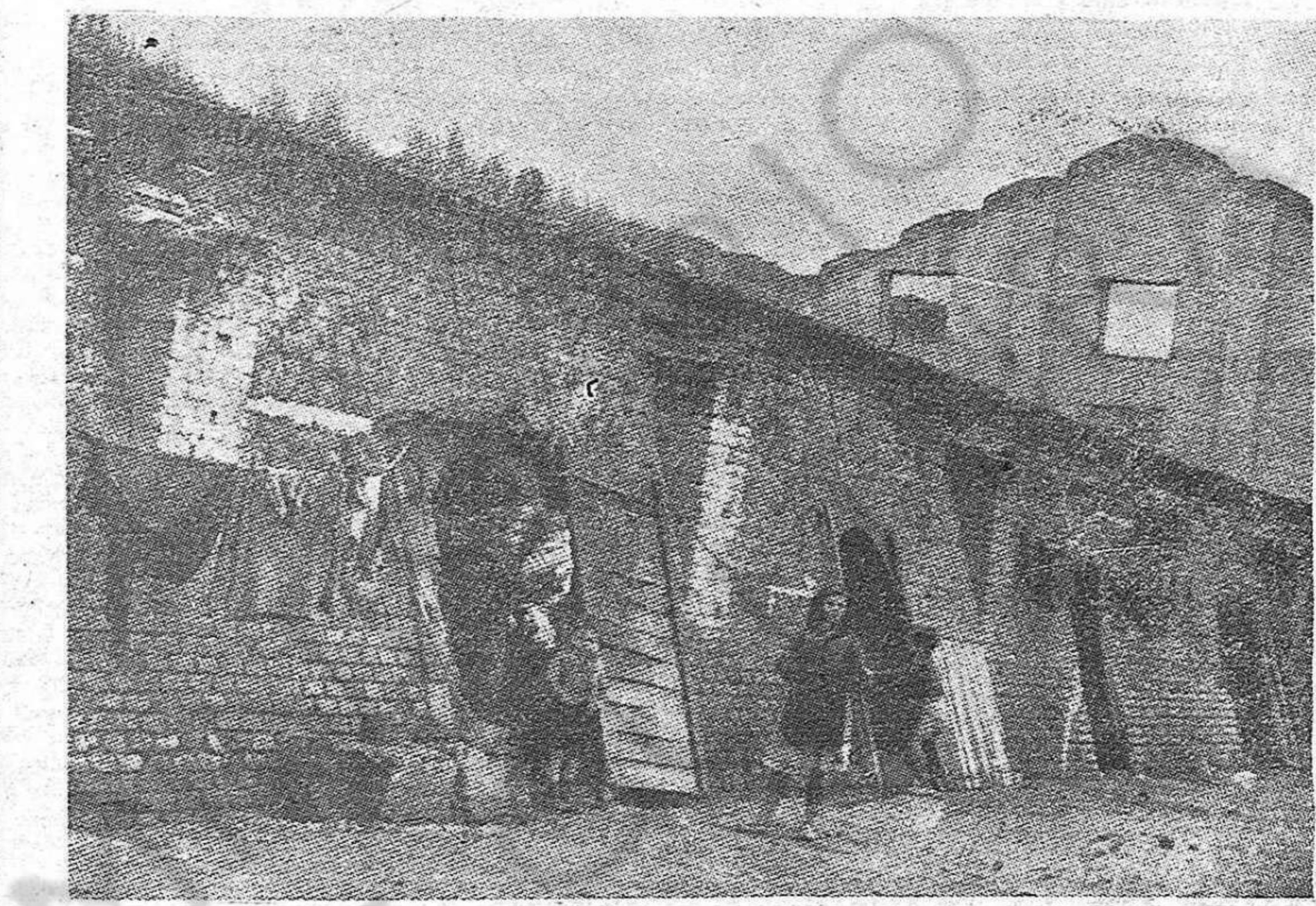
Así viven miles de familias madrileñas, ahora mismo, en julio de 1947. La presente fotografía, hecha recientemente en los barrios de Madrid por un fotógrafo norteamericano y publicada por la conocida revista "Saturday Evening Post", muestra unas ladrilleras abandonadas en cuyos hornos viven familias hasta de siete miembros. En estas cuevas sólo propias para animales, la miseria, la promiscuidad y las enfermedades son indecibles. En estas condiciones están millones de españoles al cabo de ocho años de dominación franquista.

En estas condiciones están millones de españoles al cabo de ocho años de dominación franquista.