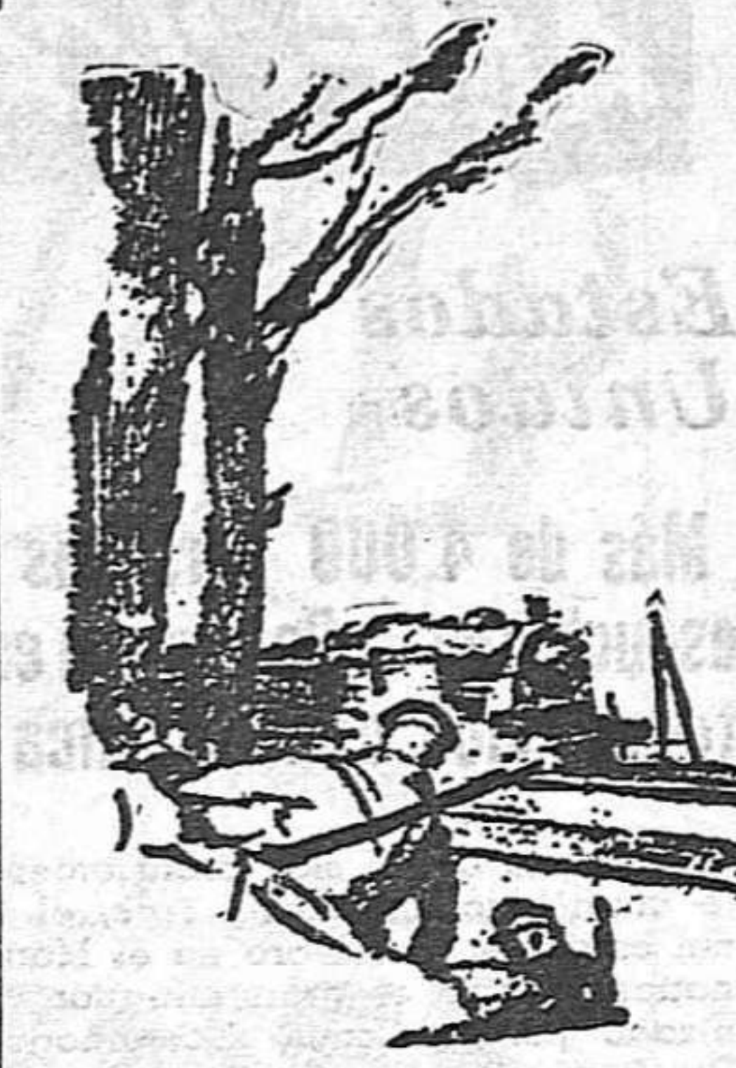
el cabo de la Guardia Civil del puesto.

Hace pocos días, en un lugar del término municipal de Ordenes (La Coruña), elementos de la Guardia Civil intentaron asaltar una casa con fines de represión. Sobrevenió un tiroteo del cual resultó herido